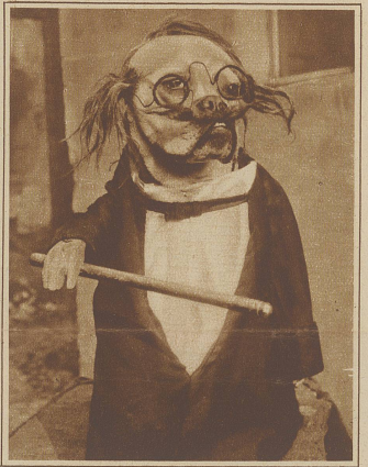
BULLY ALS KAPELLEMEISTER

banks vorgelegt und gibt hier wörtlich wieder, was Fairbanks zu diesen Fragen zu sagen hat. Ein Stenograph hat seine Rede festgehalten, doch da Doug manchmal etwas zu schnell gesprochen hat, fiel manches leider unter den Tisch.