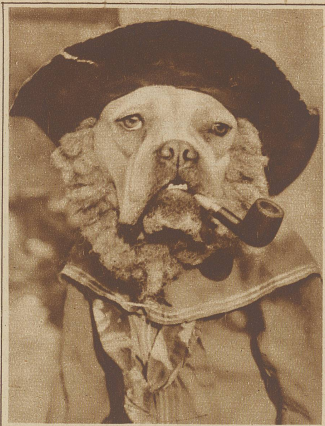
BULLY ALS MATROSE

Dabei dachte sie schon wieder an Lullo. «Paul!» stöhnte sie vor sich hin, «Paul, Paul! Ich flehe dich an, Herrgott, rette mir Paul aus dieser Nacht. Herrgott, ich flehe, ich bitte, ich bete... rette mir Paul!»