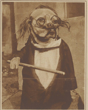
BULLY ALS KAPELLMEISTER

banks vorgelegt und gibt hier wörtlich wieder, was Fairbanks zu diesen Fragen zu sagen hat. Ein Stenograph hat seine Rede festgehalten, doch da Doug manchmal etwas zu schnell gesprochen hat, fiel manches leider unter den Tisch.