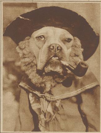
BULLY ALS MATROSE

Dabei dachte sie schon wieder an Lullo. «Paul!» stöhnte sie vor sich hin, «Paul, Paul! Ich flehe dich an, Herrgott, rette mir Paul aus dieser Nacht. Herrgott, ich flehe, ich bitte, ich bete... rette mir Paul!»