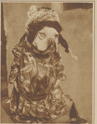
DIE BOSE SCHWIEGERMUTTER