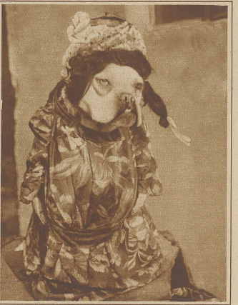
DIE BOSE SCHWIEGERMUTTER