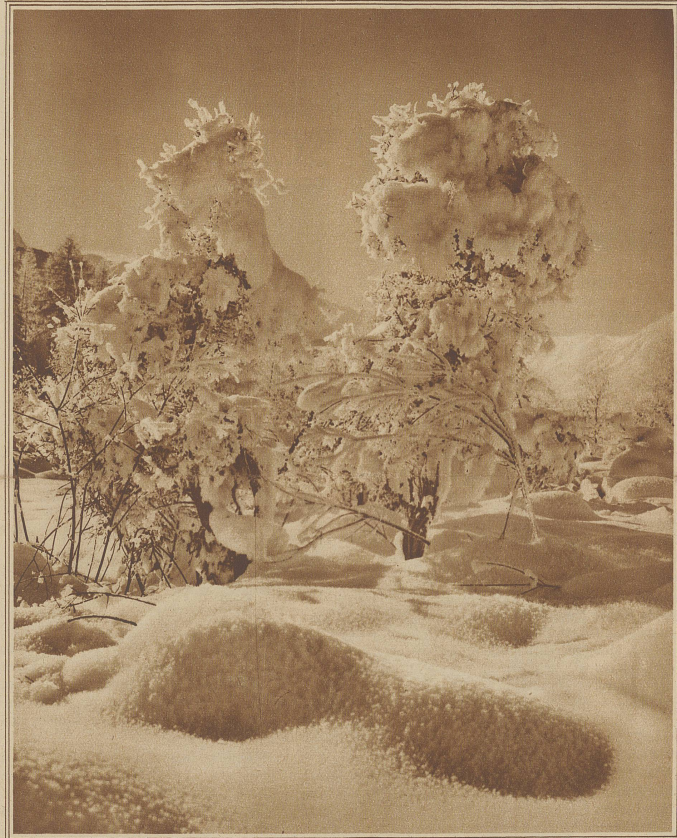
Raubreif und Neuschnee

Sie lauschte talsin, angespannt... aber das Signal wiederholte sich nicht. Sollte die tolle Phantasie dieser Nacht ihr eine Sinnestäuschung, einen ganz gemeinen Schabernack gespielt haben? Lullo würde es gewiß behaupten, der süße, kleine, seidig-schneige, der ihr Herz seit ein paar Monaten zu trösten verstand wie keiner zuvor. Lullo, der ihr allein die Kraft schenkte, mit diesem Bären von Paul, diesem tölpischen