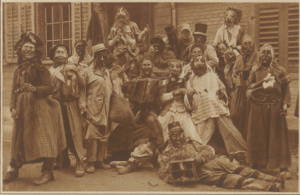
Eine Gruppe origineller Flumer Buzi beim Fastnachtstreiben, das sich in dieser Gegend noch in den Formen hundertjähriger Tradition erhalten hat