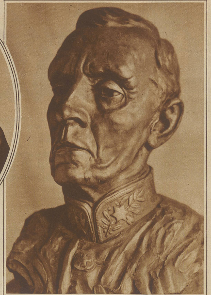
Eine von Bildhauer K. Schenk in Bern ausgeführte Sprecherbüste