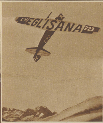
Das mit Riesenschrift versehen Reklameflugzeug, das bis zum Schluß der Olympiade täglich mit Start auf dem St. Moritzersee Passagierflüge ausführt