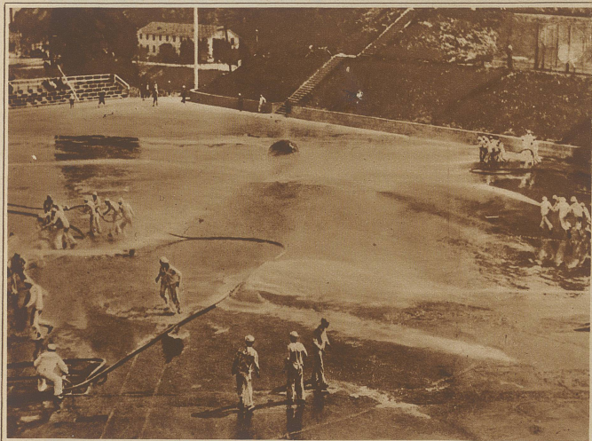
Eine echt amerikanisch anmutende Erfindung ist das Pushballspiel, das kürzlich von Matrosen in der San Francisco-Bay ausgetragen wurde. Jede Partei bediente sich dreier Hochdruckschläuche, wobei die Teilnehmer zum nicht geringen Gaudium der Zuschauer weit häufiger als Zielscheibe dienten als der Ball