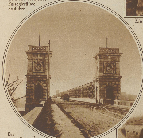
Ein eigenartiges und trauriges Jubiläum

Kann die Reichsbrücke in Wien begehen. Eine Statistik der Wiener Polizei hat festgestellt, daß sich kürzlich der tausendste Selbstmörder von ihrem Geländer in die Fluten der Donau gestürzt hat. Die Wiener Polizei, die gegen diese Verliebe der Selbstmörder machtlos ist, will jetzt auf dem Geländer eine elektrische Leitschiene anbringen lassen, die jeder berühren muß, der sich darüber in das Wasser stürzen will. Der Strom wird so reguliert, daß er erschreckt, aber nicht tödtet