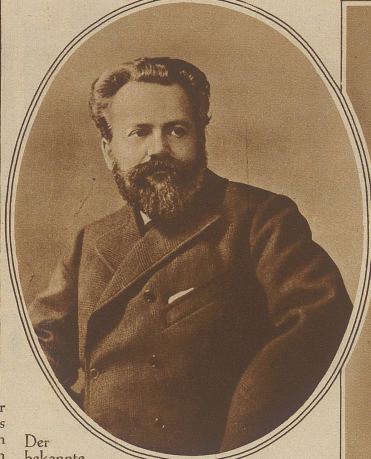
Der bekannte Schriftsteller Carl Bleibtreu ist in Locarno im Alter von 69 Jahren an den Folgen eines Herzschlages gestorben