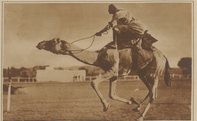
Originelles Momentbild aus einem Kamelrennen, das kürzlich ganz nach den Vorbildern des europäischen Rennbetriebes in Kairo durchgeführt wurde