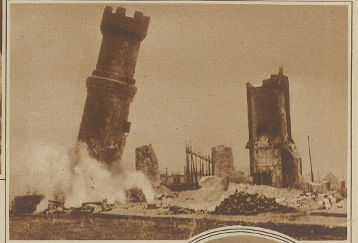
Bild rechts: Sprengung eines 60 m hohen Turmes der Eisenbahnwerkstätte in Boston (Mass.), die einem neu zu errichtenden Stadion weichen mußte