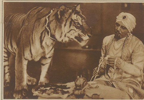
Ein unheimlicher Tischgast. Der Sensationsfilmdarsteller Harry Piel mit seinem liebtingtiger Baylard