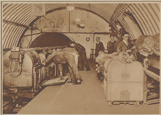
Eröffnung einer Postuntergrundbahn in London. In der ganzen Welt ist die Londoner Post die erste, die verschiedene ihrer größten Postämter durch eine Untergrundbahn miteinander verbindet. Die Länge der bis jetzt ausgebauten Bahn beträgt 6 1/2 Meilen. Die Züge sind führerlos und werden durch eine Schalttafel, die ein einziger Beamter bedient, geleitet. Unser Bild zeigt eine Postuntergrundbahnstation