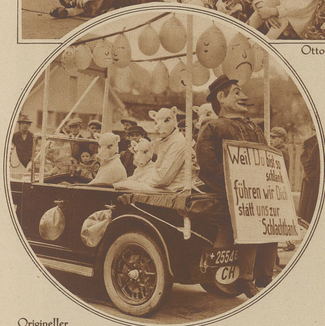
Origineller Wagen aus dem diesjährigen Fritschiumzug in der Leuchtenstadt