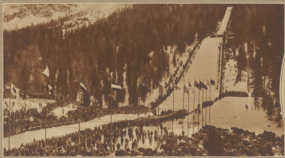
Die Olympia-Schanze während des großen Sprunglaufes, dem gegen 10,000 Zuschauer beiwohnten

Im Oval: Thullin Thams, der olympische Sprunglaufsieger des Jahres 1924, erreichte in St. Moritz die Rekord-Sprunglänge von 73 m, stürzte jedoch beim Niedersprung