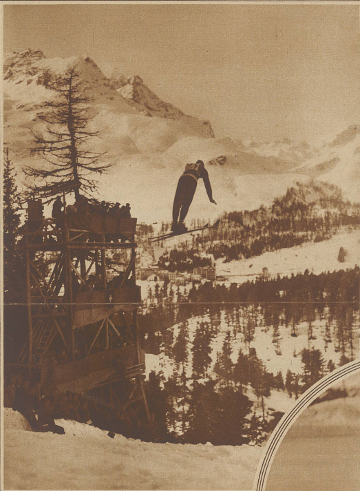
Ein prächtiger 64 m Sprung des Siegers Alf Andersen, Norwegen