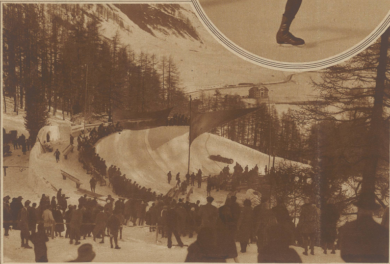
In sausender Fahrt durch den Sunnycorner