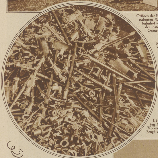
Links: Das Lager der unbrauchbar gemachten Maschinengewehrteile, das trotz Protest des Völkerbundspräsidenten zum Preise von 18000 Pengö versteigert wurde