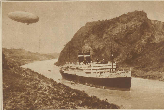
Rechts oben: Der erfolgreiche Dauerflug der «Los Angeles». Das Luftschiff landete auf dem France-Field (Panama) nach einem Flug von 3500 km. Das Bild zeigt die «Los Angeles» über dem Panamakanal