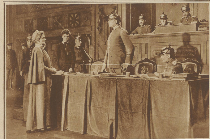
Miß Cavell vor Gericht. Eine Szene aus dem auf Einspruch der deutschen Regierung in England verbotenem Film «Nurse Cavell». Miß Cavell ist bekanntlich während des Weltkrieges von den Deutschen erschossen worden