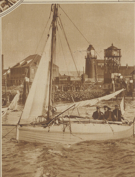
Mit dem Segelboot über den Atlantik. Das nach den Plänen eines 79-jährigen, seemanns gebaute kleine Segelschiff «Schuttveer», dessen Konstruktion das Untergehen ausschließen soll, ist am 30. Februar mit vier wagemutigen Seelern in See gestochen. Schuttveer und seine Begleiter wollen die Lieberfahrt in 40 Tagen vollenden