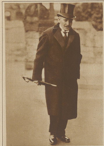
Fürst Lichnowsky, der ehemalige deutsche Botschafter in London, bekannt durch seine vergeblichen Versuche, den Ausbruch des Weltkrieges zu verhindern, ist im 69. Lebensjahre gestorben