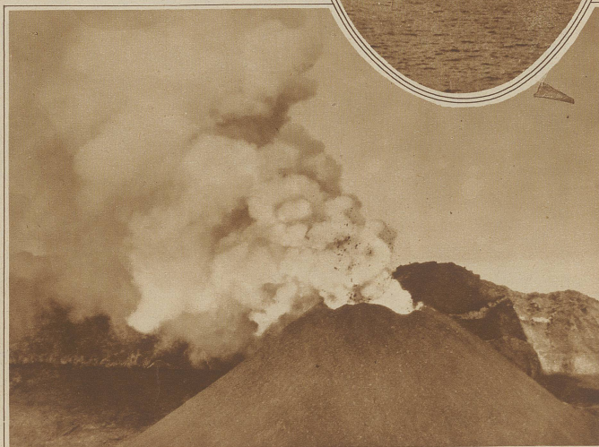
Ein aus nächster Nähe aufgenommenes Bild des seit Dienstag wieder stark tätigen Vesuv. Große Stein- und Lavablocke wurden bis zu 50 m in die Luft geschleudert