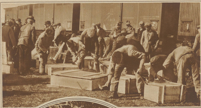
Öffnen der Kisten mit den beschlagnahmten Waffen auf dem Staatsbahnhof von Szent-Gotthard an der österreichisch-ungarischen Grenze