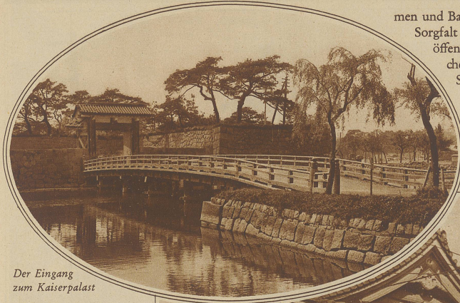
Der Eingang zum Kaiserpalast

men und Baumbestand mit der größten Sorgfalt gepflegt werden. In keiner öffentlichen Anlage fehlen die Teiche mit ihren Goldfischen und Seerosen. Das eigentliche Vergnügungszentrum mit Kinos, Theatern, Varietés, Teehäusern und Verkaufsläden, in denen besonders Spielsachen und Scherzartikel zu haben sind, ist der