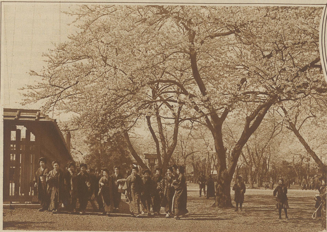
Japanische Kirschbäume im Blütenschmuck

Gebäuden eines Straßenzuges, aber in ihrem Innern entfaltet sich ein märchenhafter Luxus und zu den meisten gehört auch ein mit den