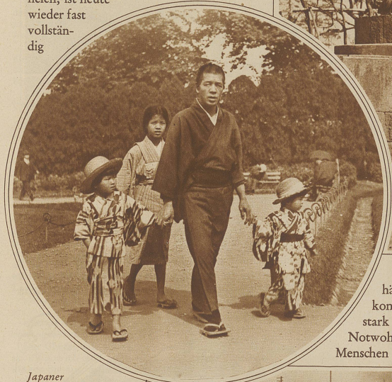
Japaner auf dem Spaziergang mit seinen Kindern

häuschen errichtet, die durch ihre Wellblechkonstruktion das Landschafts- und Stadtbild stark nachteilig beeinflussten. Heute sind diese Notwohnungen wieder fast ganz verschwunden, die Menschen wohnen wieder in ihren zierlichen Holz-