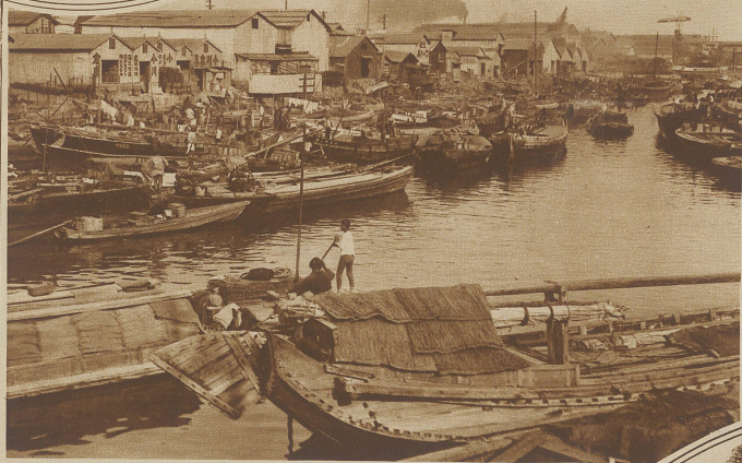
Leben und Treiben auf einem Schiffsfahrtskanal

aufgebaut. Wohl hat sich allerlei an dieser Hauptstadt Japans, die beinahe 2 1/2 Millionen Einwohner zählt, in der Zwischenzeit verändert, aber der Hauptcharakter der Stadt ist unverändert geblieben. Immer noch besitzt sie eine ungeheure Flächenausdehnung, da die Häuser zumeist nur einstöckig und freistehend gebaut werden.