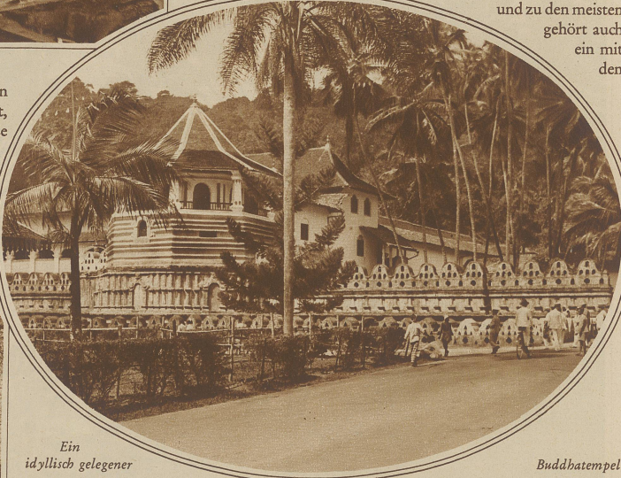
Ein idyllisch gelegener