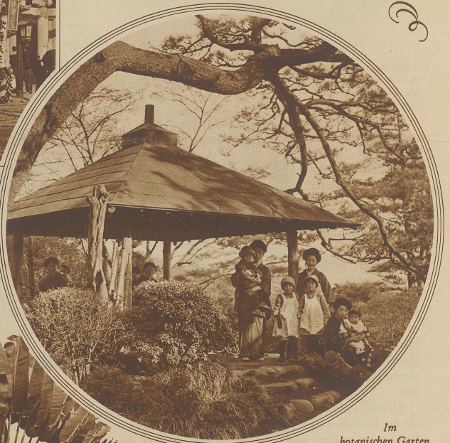
Im botanischen Garten

Asakusa-Park. / Den Fremden gegenüber ist der Japaner von einer ausgesuchten Höflichkeit und, wenn er bei ihm zu Gaste ist, für dessen Behaglichkeit in hohem Maße besorgt. Beim Betreten des Hauses zieht