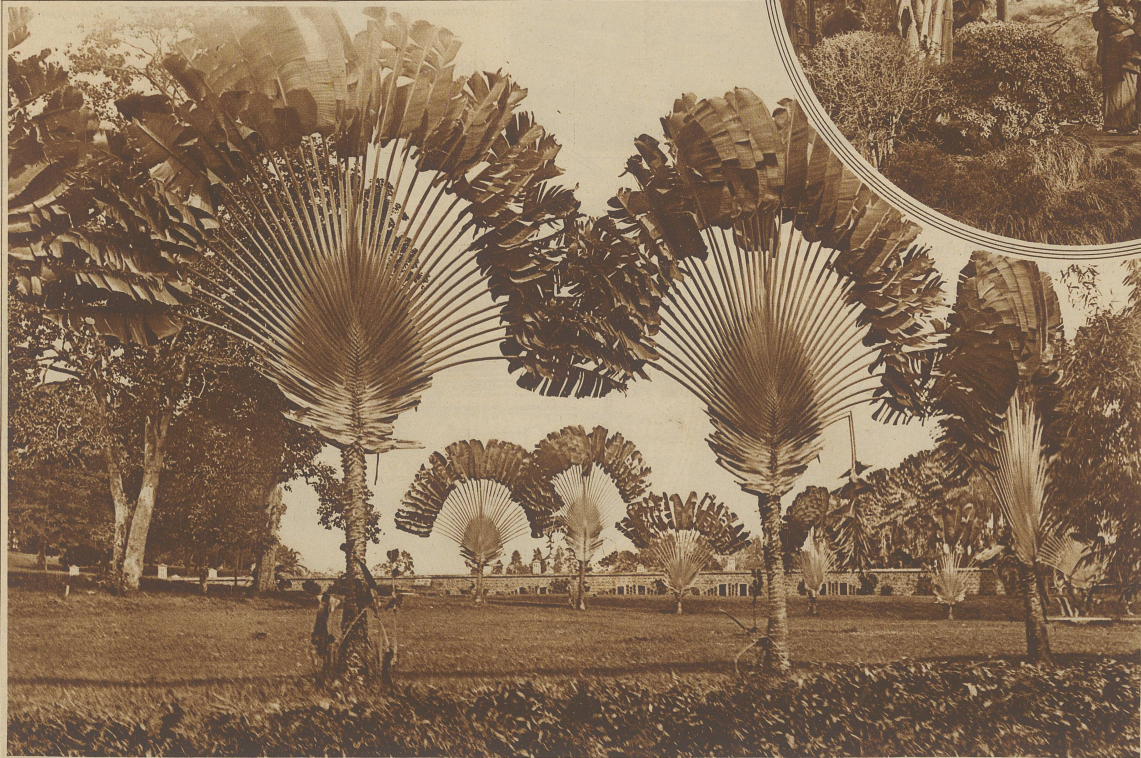
Prächtige Fächerpalmen, «Baum der Reisenden» genannt, weil sich an den Blattwurzeln Tau und Wasser sammeln

Sitzgelegenheiten in dem uns gewohnten Sinne kennt der Japaner nicht, er selbst kniet auf dem Boden, dem Gaste bietet er Seidenkissen. Zwischen den einzelnen Gängen einer reichen Mahlzeit tanzen und singen die Geishas und ermuntern den Gast zum Trinken.