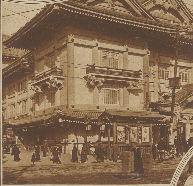
Das in altjapanischem Stil, jedoch ganz in Beton erbaute Kalkukiza-Theater

Neben den eigentlichen baulichen Anlagen sind besonders die schönen Parks und öffentlichen Gärten sehenswert, deren Blu-