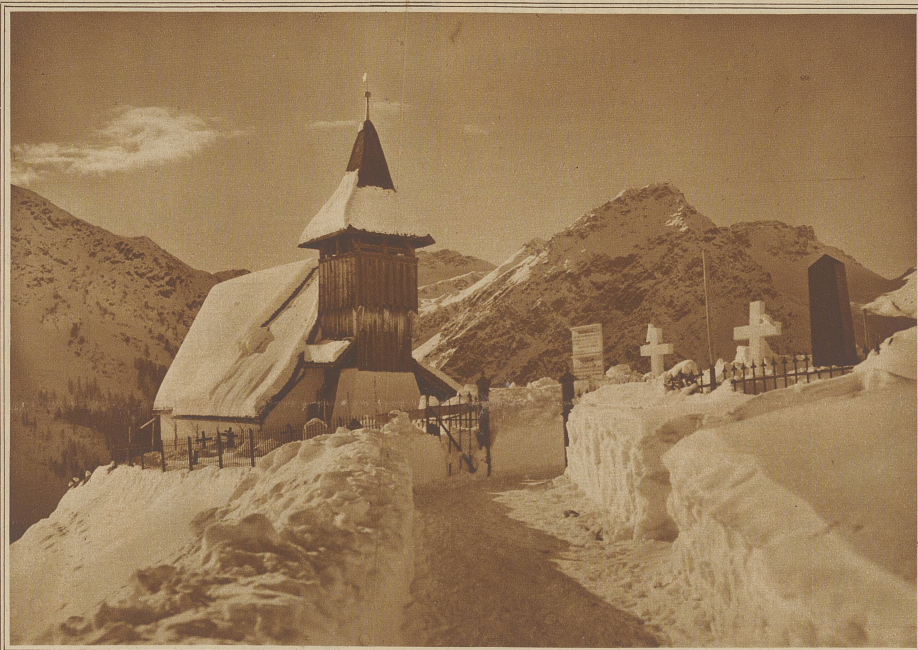
Das Kirchlein von Innerarofa