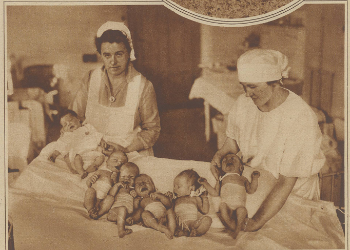
Sie werden nur alle vier Jahre Geburtstag haben. Eine Gruppe junger Erdenbürger, die am 29. Februar in einer Frauenklinik das Licht der Welt erblickten