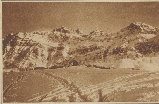
Ueberblick über den Absturz. Der Pfeil zeigt die Absturzhöhe von etwa 500 Metern