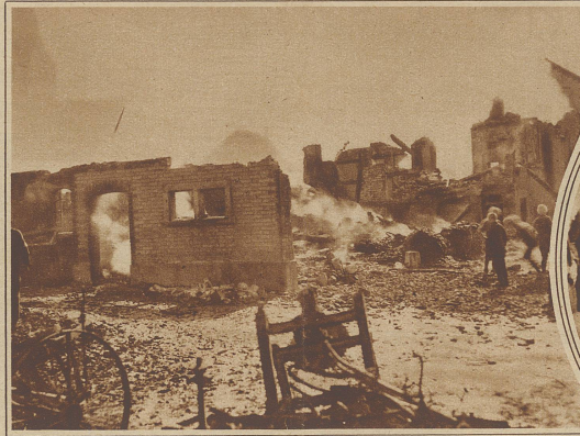
Blick auf die Brandruinen