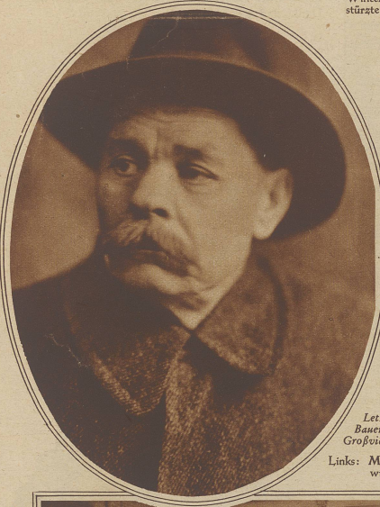
Links: Maxim Gorki, der bekannte russische Schriftsteller, wird diesen Monat 60 Jahre alt