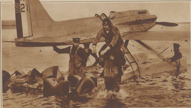
Der bekannte englische Flieger Kinkead stürzte beim Versuch, den Geschwindigkeits-Weltrekord zu schlagen, ins Meer und ertrank. Schon am Samstag zwang ihn ein Körperstich zu einer Notlandung, die, wie unser Bild zeigt, glücklich verlief. Beim nächsten Versuch am Montag erreichte ihn das Schicksal