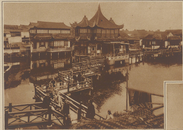
Eine eigenartige Zick-Zack-Brücke in der Chinesenstadt Schanghai