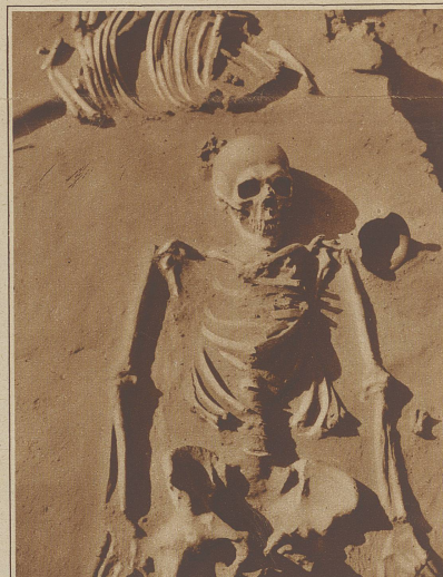
Der Mensch der Urzeit. Bei den Arbeiten am Dnjepr-Kraftwerk wurden wichtige archaische Ausgrabungen gemacht. So fand man u. a. ein vollständig erhaltenes Menschenskelett, das neben einem Pferd begraben war und vermutlich einige Tausend Jahre alt ist. Auffallend sind die unverhältnismäßig langen Arme