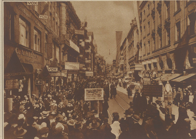
Messebetrieb auf dem Neumarkt in Leipzig während eines der Haupttage