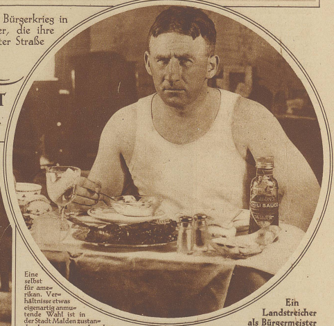
Ein Landstreicher als Bürgermeister

Eine selbst für amerikan. Verhältnisse etwas eigenartig anmutende Wahl ist in der Stadt Malden (Massachusetts) abgekommen, wo neben dem offiziellen Kandidaten im letzten Augenblick durch einige Spaßvögel ein Landstreicher als Bürgermeister vorgeschlagen wurde. Und nichts — der Mann wurde zum nicht geringen Schrecken, selbst solcher, die ihm ihre Stimme gaben, gewählt. Die erste Amtshandlung spielte darin, dass er sämtliche Scheine absetzte und Freunde und Verwandte an ihre Stelle setzte. Das Bild zeigt den Bürgermeister beim Frühstück