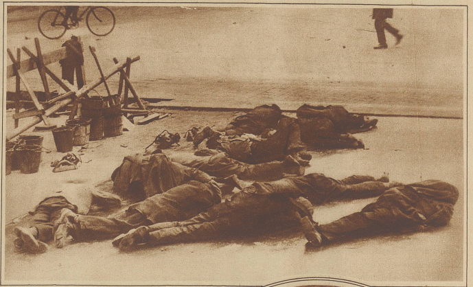
Nicht etwa eine Szene aus dem Bürgerkrieg in Kanton, sondern Asphaltarbeiter, die ihre Mittagspause auf einer Budapester Straße schlafend verbringen