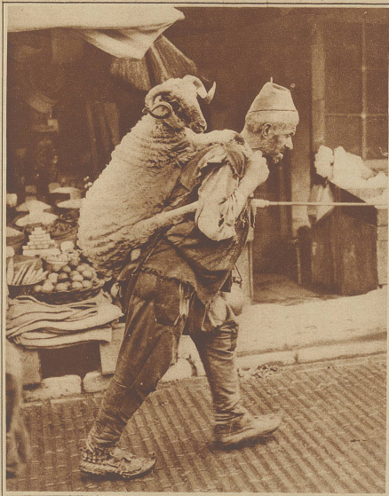
Straßenbild aus Serafewo: Ein Türke bringt ein Schaf auf den Markt