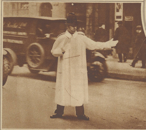
Unten: Neue Versuche auf dem Gebiete der Verkehrsregelung: Ein englischer Verkehrspolizist in weißem Mantel, der ihn auf größere Distanz sichtbar macht