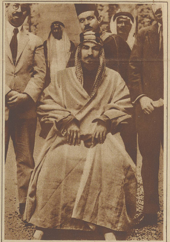
IBN SAÛT der geistige Führer der Aufständischen in Arabien

Eine selbst für amerikan. Verhältnisse etwas eigenartig anmutende Wahl ist in der Stadt Malden (Massachusetts) abgekommen, wo neben dem offiziellen Kandidaten im letzten Augenblick durch einige Spaßvögel ein Landstreicher als Bürgermeister vorgeschlagen wurde. Und nichts — der Mann wurde zum nicht geringen Schrecken, selbst solcher, die ihm ihre Stimme gaben, gewählt. Die erste Amtshandlung spielte darin, dass er sämtliche Scheine absetzte und Freunde und Verwandte an ihre Stelle setzte. Das Bild zeigt den Bürgermeister beim Frühstück