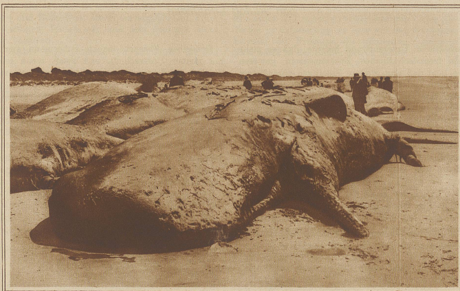
32 gestrandete Walfische. Auf einer kleinen Insel vor der Nordwestküste von Tasmania, nicht weit von der Flußmündung des Duck entfernt, fand man eines Morgens nicht weniger als 37 Walfische auf dem Strande liegen. Von Hunger getrieben, wagten sie sich offenbar während der Zeit der Flut in seichtes Wasser und konnten sich dann nicht mehr zurückarbeiten, als zur Ebbezeit das Meer zu sinken begann.

Drei Trompetenstöße kündeten die Ankunft des Königs an.