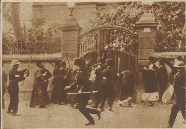
Zu den Unruhen in Kairo. Bild eines Straßenkampfes vor dem Palast Zaglal Paschas. Die Polizei versuchte revoltierende Studenten zu verhaften, wurde aber von der Menge daran gehindert und mit Steinen beworfen