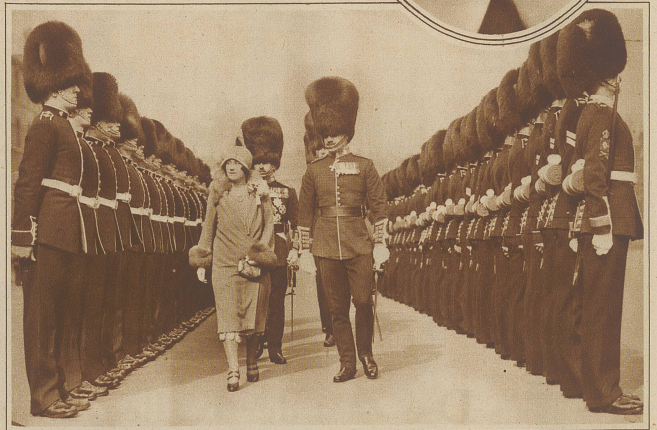
Inspektion englischer Gardisten durch die Prinzessin von York