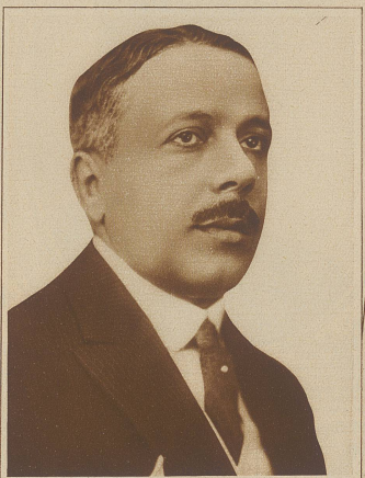
Dr. Octavio Mangabeira Brasilien's Außenminister

die Spielkarten in Frankreich bereits im Anfang des 14. Jahrhunderts kannte. Das Kartenspiel erreute sich am französischen Hofe sehr bald großer Beliebtheit und fand unter allen Ständen weiteste Verbreitung. In einer alten Oper «Karl VI.» wird diese Tradition dramatisch wirksam benutzt. Ein berühmter Kartenmaler jener Zeit war Jaquemin Gringonneur. Auf der National-Bibliothek in Paris befinden sich sieben Stück von der Hand Gringonneurs gemalte Karten, welche wahrscheinlich zu einem größeren Spiele gehörten. Sie haben mit den heutigen weder in bezug auf die Größe, noch Figuren und Farben Ähnlichkeit. Diese Karten enthalten kleine Gemälde; dargestellt sind der Papst, der Kaiser, der Eremit, die Sonne, der