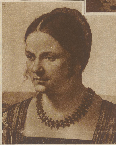
Bildnis einer Frau