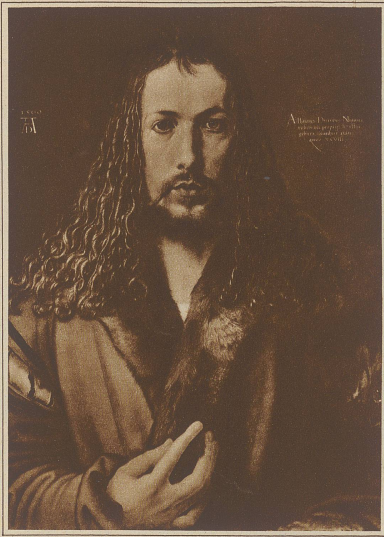
Albrecht Dürer, Selbstbildnis des Künstlers

Nicht ganz siebenundfünfzig Jahre alt starb am 6. April 1528 Albrecht Dürer. Auf der einfachen Steinplatte, die sein Grab auf dem Johannesfriedhof in Nürnberg deckt, steht eine lateinische Inschrift, die übersetzt etwa so lautet: «Was immer an Albrecht Dürer sterblich war, das deckt dieser Hügel.»