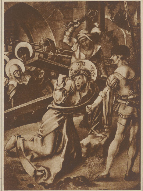
Werkstatt Dürers, Kreuztragung

Als Maler kennen wir Dürer hauptsächlich von Porträten und Darstellungen religiöser Momente. Das formal Neue in seiner Kunst ist das ungemein körperliche