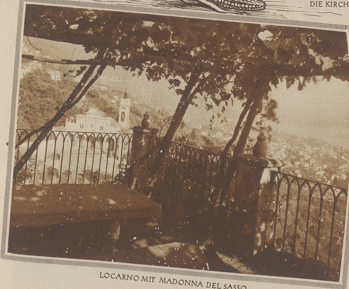
LOCARNO MIT MADONNA DEL SASSO