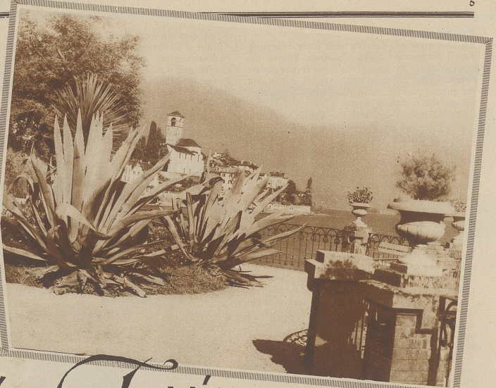
BLICK AUF BRISSAGO