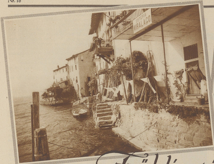
PARTIE AUS GANDRIA