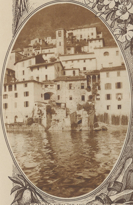
GANDRIA VOM SEE AUS GESEHEN