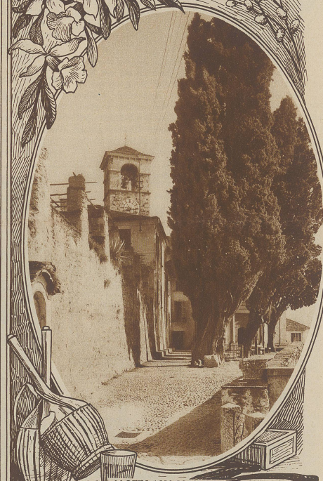
MOTIV AUS BRISSAGO