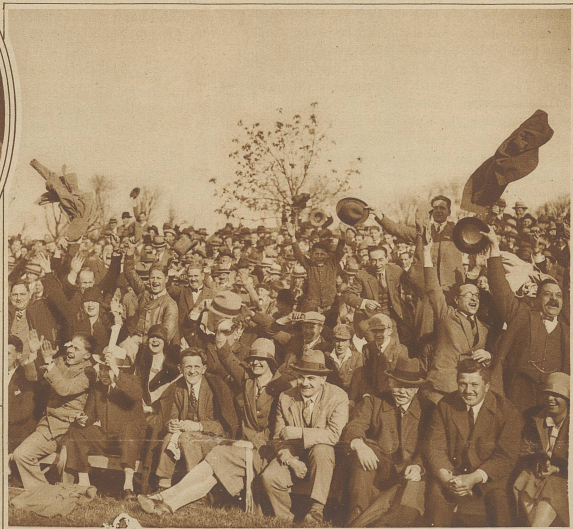
Das zweite Tor der Schweizer im Spiegel des Publikums