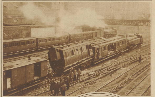
Auf der Unglücksstelle am Eingang des Nordbahnhotels