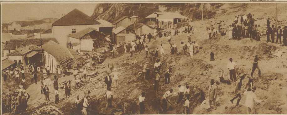
Zur Bergsturz-katastrophe in Santos (Brasilien). Rettungsmannschaften suchen nach den über 100 Verschütteten