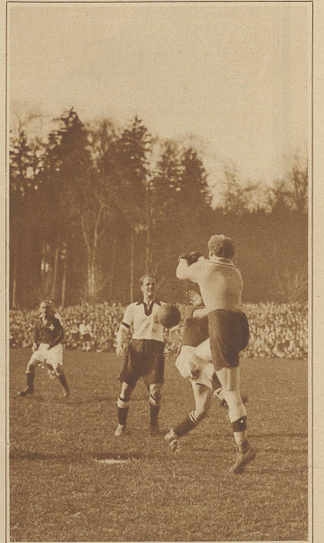
Der deutsche Torwart faustet