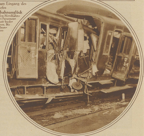
Zwei vollständig ineinandergeschachtelte Wagen. Die Coupés des vordersten Zweitklasswagens sind rasiert, alle darin sitzenden Passagiere wurden getötet