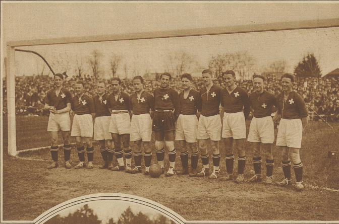
Die Schweizer Nationalmannschaft