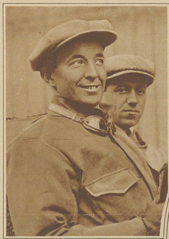
Der bekannte Autorennfahrer Bordini ist auf einer Versuchsfahrt in Turin zu Tode gestürzt. Ein in die Rennbahn gesprungener Hund brachte das Auto zum Stürzen