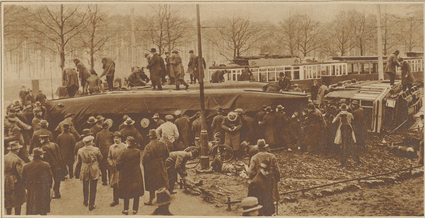
Straßenbahnunglück in Berlin. Am Sonntagnachmittag entgleiste in einer Kurve ein vom Stadion herkommender Straßenbahnzug. Alle drei Wagen stürzten um. Die Zahl der Verunglückten beträgt 96. Davon wurden 5 getötet, 81 mehr oder weniger schwer verletzt und 60 leicht verwundet. Einer unserer Mitarbeiter befand sich im Unglückszug und konnte dieses gräßliche Bild unmittelbar nach dem Unglück aufnehmen