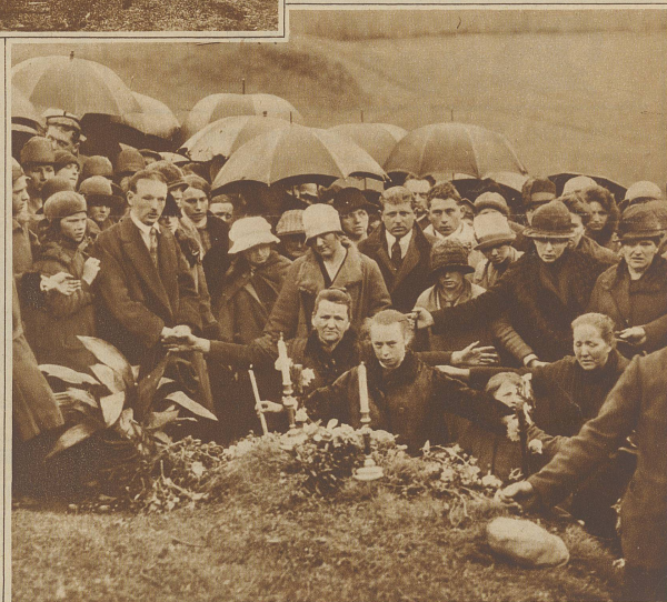
Von einem seltsamen Wunder wird aus den Vogesen berichtet, wo ein 13-jähriges Mädchen behauptet, daß ihm jeden Nachmittag um 4 Uhr an einem bestimmten Platz die Mutter Gottes erscheine. Die Nachricht fand natürlich rasche Verbreitungen und nun pilgern jeden Tag Hunderte von Gläubigen zu dem Flecken hin, wo das Kind seine Gebete verrichtet