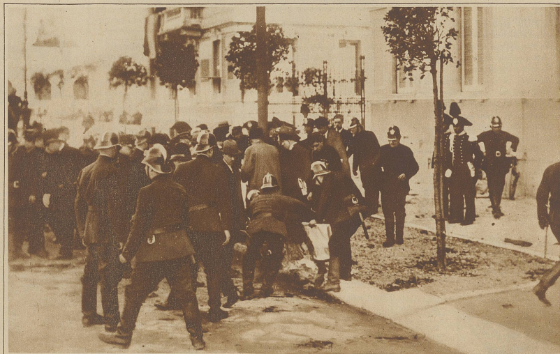
Zum Attentat auf den König von Italien. Aufräumungs- und Bergungsarbeiten nach dem Attentat