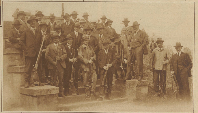
Die Schweizer Matchschützen anlässlich des Trainingschießens im Albisgütli