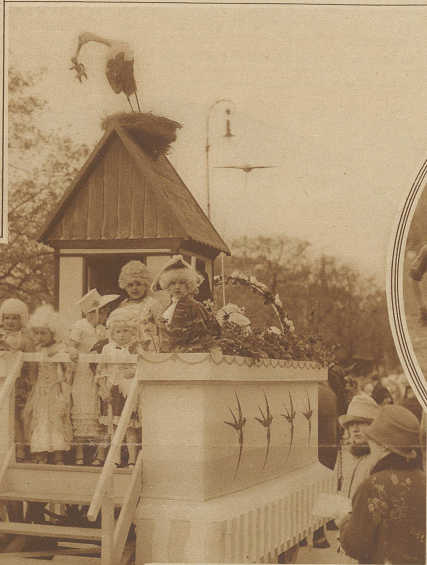
Wie der Storch die Kinder bringt