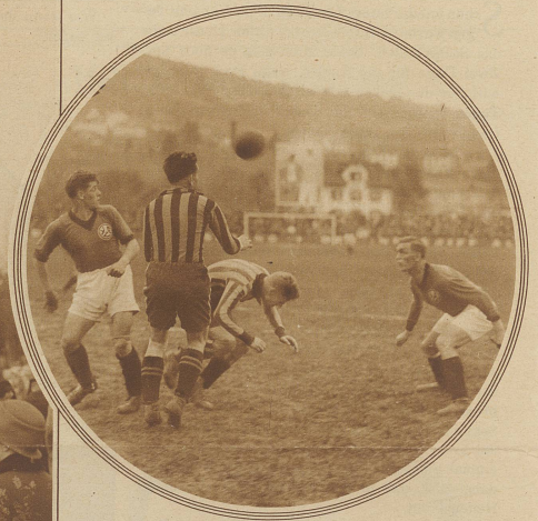
Kampfbild aus dem Spiel Young Fellows-Young Boys