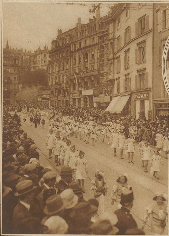
Darstellerinnen des Hardturmes