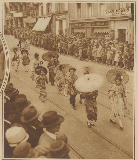
Die japanische Delegation