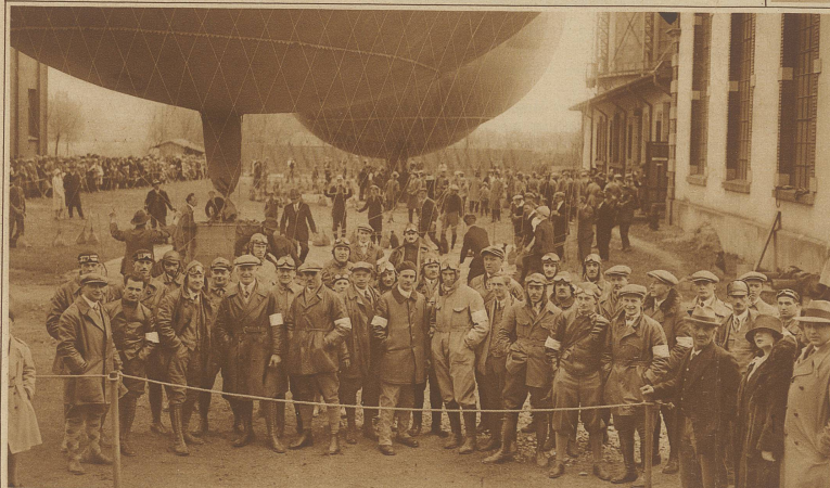
Die Teilnehmer der Fuchsjagd