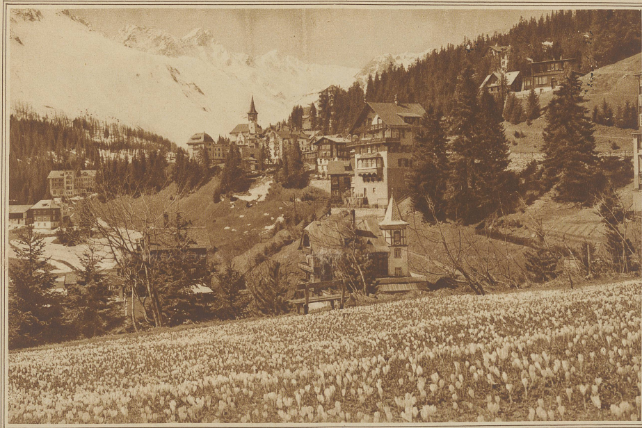
Arosa im Frühling