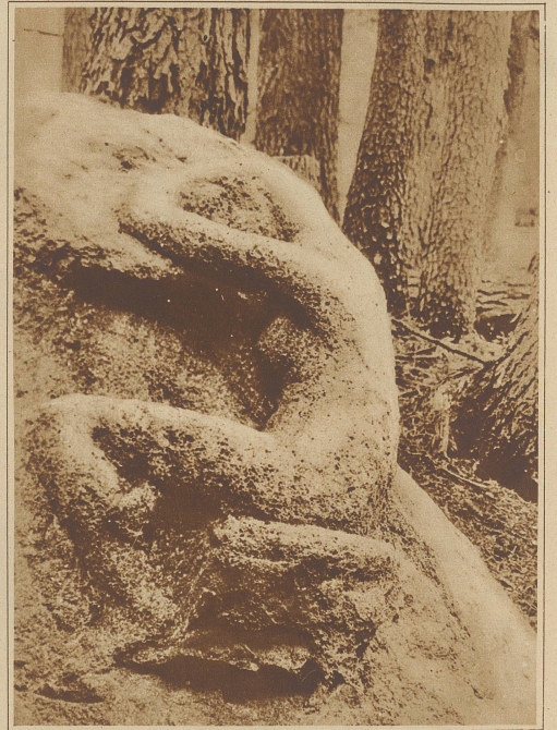
Eines der seltsamsten Naturwunder ist diese Figur einer Frau zwischen den Llamath-Fällen und Eugene in Oregon, Amerika. Ihr Entstehen wird auf eigenartige, versteinerte Wurzelbildungen zurückgeführt. Uns scheint allerdings, daß an der Formung der «Oregon-Lady» — so heißt das Naturwunder — auch Menschenhände mitgeholfen haben