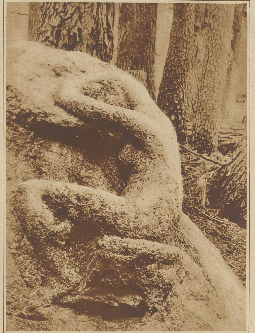
Eines der seltsamsten Naturwunder ist diese Figur einer Frau zwischen den Llamath-Fällen und Eugene in Oregon, Amerika. Ihr Entstehen wird auf eigenartige, versteinerte Wurzelbildungen zurückgeführt. Uns scheint allerdings, daß an der Formung der «Oregon-Lady» — so heißt das Naturwunder — auch Menschenhände mitgeholfen haben