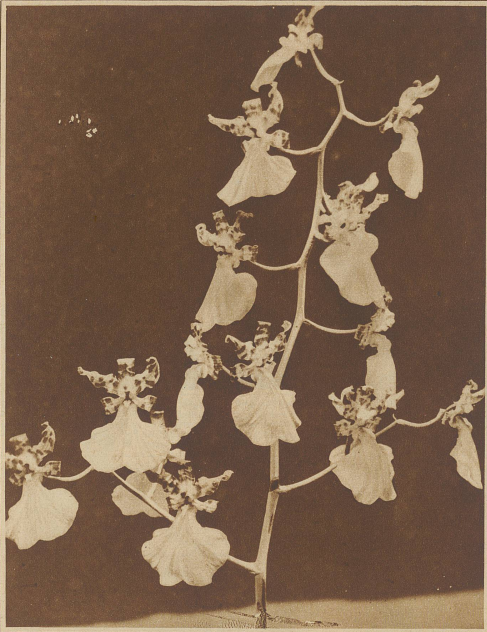
Ein Ballett? — Nein, aber ein interessantes Bild einer Orchidee, deren Blüten wie tanzende Pappeln erscheinen