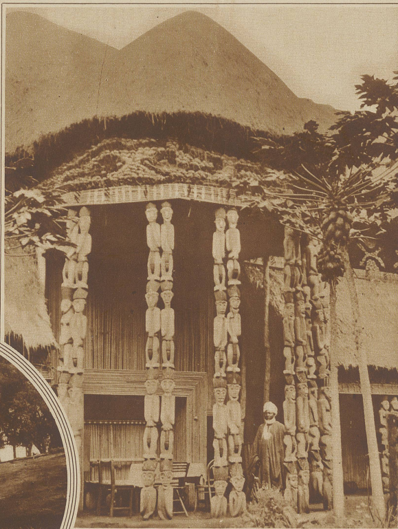
Der Palast eines Häuptlings. Die geschnitzten Figuren der Säulen sind Götzen darstellungen

strumente, die die amerikanischen Neger aus Afrika importierten und die uns unter dem Namen Banjo in kunstvollerer Form genügend bekannt geworden sind. / Für