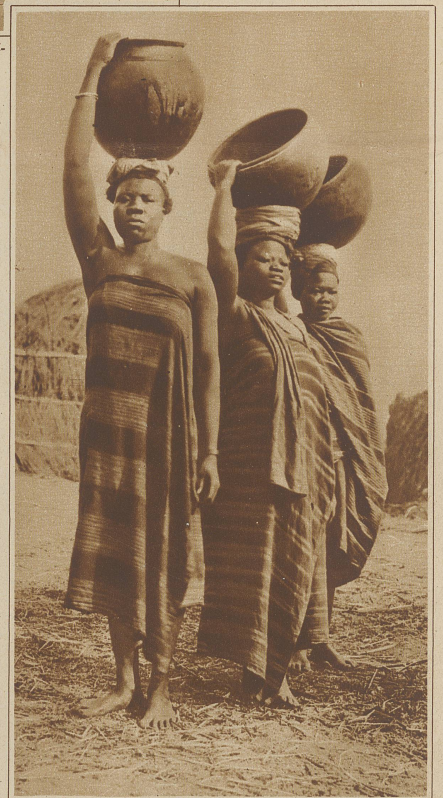
Hausa-Frauen mit selbstgefertigten Tongefäßen

Ein Klopstelegraph in Kamerun. Die durch Schlagen auf dem hohlen Baumstamm erzeugten Zeichen sind bei günstigen Verhältnissen kilometerweit hörbar