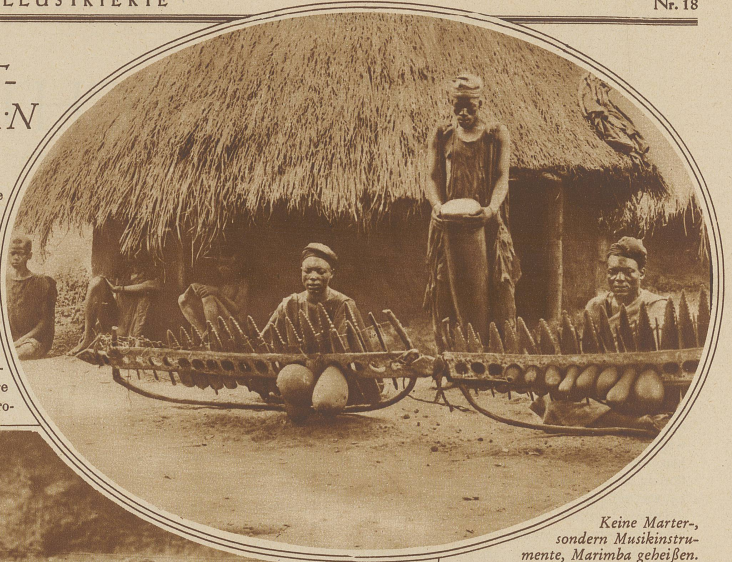
Keine Marter-, sondern Musikinstrumente, Marimba geheißen.

Die auf dem durchlöchernten Querbalke aufgespannten Hölzer sind verschieden lang und geben so beim Anschlagen verschieden hohe Töne