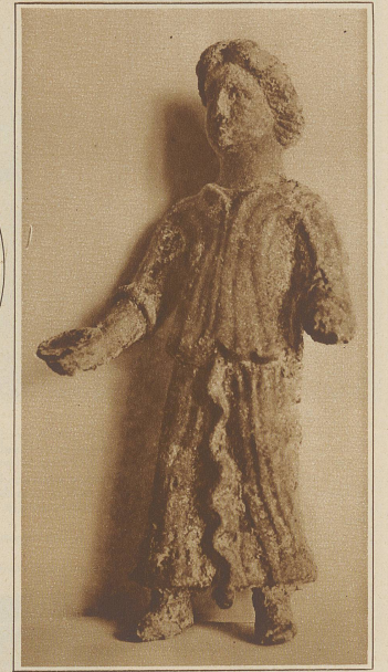
Die Göttin Hygieia, welche im Flußbett der Aare bei Brugg gefunden wurde

ab. Vor allem erregten Zaghafte den Zorn des Volkes, das sich beleidigt sah, wenn ein Gladiator nicht gerne sterben wollte. Unter den tierischen Ueberresten hat man in der großen Arena von Vindonissa auch Knochen eines Kameles gefunden