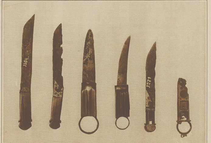
Verschiedene Messerformen. Die beiden Hefte links sind aus Bein mit Bronze, die der Mitte aus Bein mit Eisenring und die beiden rechts aus reiner Bronze