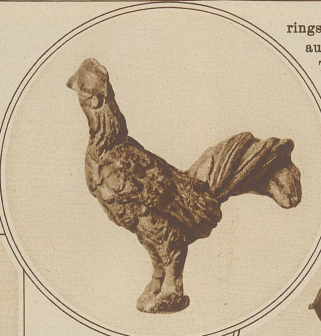
Ein Hahn als Ziergegenstand

Pfeilspitzen usf. zutage, sondern auch vollständig erhaltene Pferdebeschläge, Schuhsohlen, Toilettengegenstände und Trinkgeschirre. Sogar Schreibtafeln mit Wachstüberzug und noch erkennbaren Schriftzügen, auf denen die Legionssoldaten glühende Liebesbriefe an ihre Auserwählten geschrieben haben, sowie Aprikosen- und Pfirsichkerne sind vorhanden, als ob sie ge-