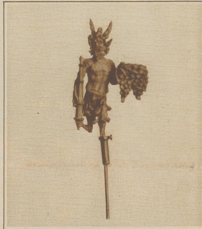
Der berühmte Pan von Vindonissa, eine Bronzefigur mit einer Fackel in der Rechten und einer Muschel mit Früchten in der Linken

im Waffenhandwerk üben konnte. — Zu den beliebtesten Spielen zählten die Kämpfe wilder Bestien gegen Menschen. Geübte Männer stritten aber auch vor versammeltem Publikum auf Leben und Tod. Von der Hauptwaffe, die dabei zur Verwendung kam, dem Gladius (Schwert), nannte man sie Gladiatoren, meist stark gebaute Sklaven, die durch jahrelange Übung ihre angeborene Kraft womöglich noch gesteigert hatten. Wurde im Einzelkampfe ein Fechter verwundet, so rief das Zuschauervolk «Habet» (er hat eins). War einer niedergeworfen, aber noch am Leben, so überließ der Festgeber die Entscheidung über Leben und Tod dem Volke.