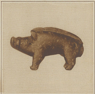
Nachbildung eines Schweines, vermutlich ein Ziergegenstand oder ein Spielzeug

Der Adel und die Offiziere lebten in luxuriösen Villen, deren Fundamente mit raffiniert angelegten