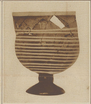
Ein echter «Römer» aus Glas, der nun nahezu zwei Jahrtausende überlebt hat

Brot und Spiele! war auch damals die Losung des Volkes. Das Heerlager belustigte sich daher hauptsächlich durch Tierhetzen und Kampfspiele nach dem Vorbilde Roms. Die Soldaten errichteten in der Nähe des Lagers die heute gänzlich freigelegte große Arena und schlugen