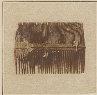
Kamm einer Römerin

Pfeilspitzen usf. zutage, sondern auch vollständig erhaltene Pferdebeschläge, Schuhsohlen, Toilettengegenstände und Trinkgeschirre. Sogar Schreibtafeln mit Wachstüberzug und noch erkennbaren Schriftzügen, auf denen die Legionssoldaten glühende Liebesbriefe an ihre Auserwählten geschrieben haben, sowie Aprikosen- und Pfirsichkerne sind vorhanden, als ob sie ge-