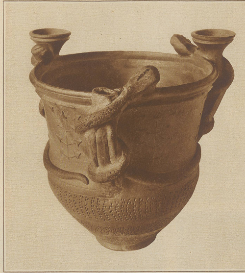
Ein prächtiges Opfergefäß mit Schlangenzierung

Westlich der Stelle, wo Aare, Reuß und Limmat sich vereinigen, erhebt sich das Dorf Windisch. Bis vor verhältnismäßig kurzer Zeit wußte man nur aus älteren Ueberlieferungen, daß die Terrasse, auf der das berühmte Kloster Königfelden steht, und welche die wichtigsten Tallinien der Mittelschweiz beherrscht, im 1. Jahrhundert nach Christus das Aussehen einer prunkvollen römischen Kolonie hatte, die etwa von 10.000 Legionären und schönen Römerinnen