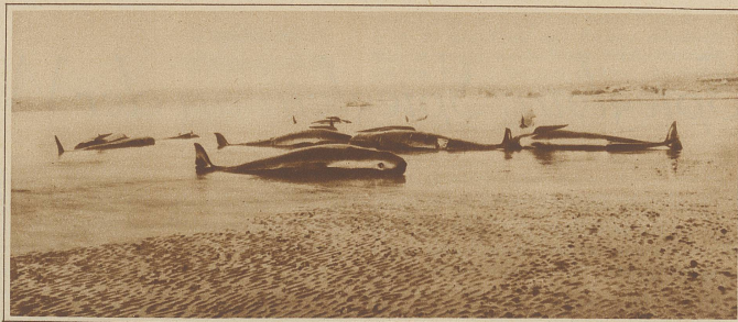
Gesträndete Piloten-Walfische, oder Schwarzfische

Kleins, leb' wohl! Unsere Wege trennen sich jetzt, wahrscheinlich für immer! Der meine führt wieder dem Genuß und der Freude entgegen. Wie schade ist es doch, daß Du, gerade Du, in die Hände dieses Rüpels fallen mußtest!