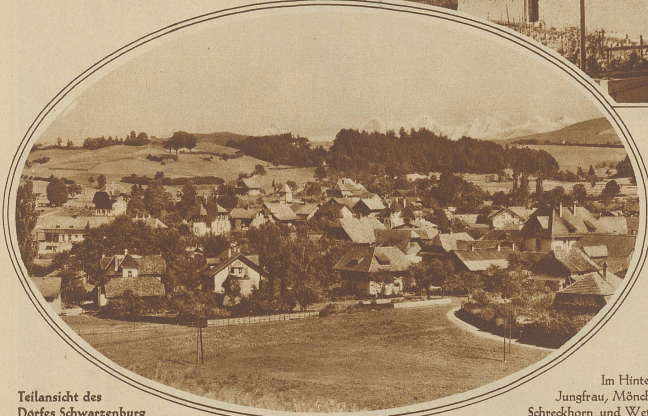
Teilsicht des Dorfes Schwarzenburg