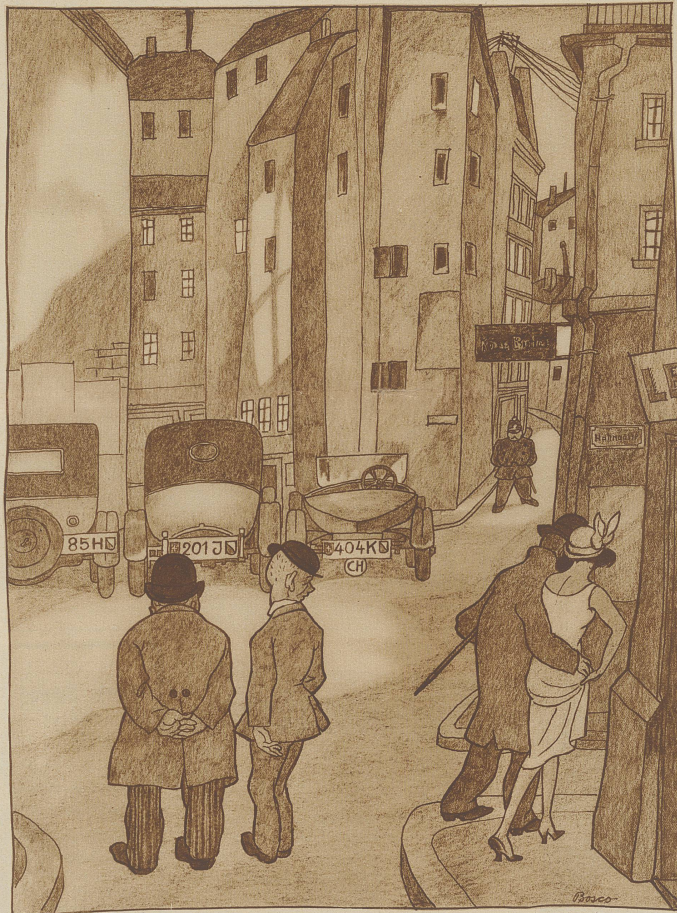
«Was bedeutet au die Buchstabe H, J, K - a dene Auto?» «...Hau's Jn Kübel!»

Wut auslassen und mir den schönsten Regenwetterartikel verderben, indem er die Sonne leuchten läßt. Mir ist es recht: Denn ein schöner Frühling ist mir trotz allem lieber als ein verregneten Schlechtwetterartikel.