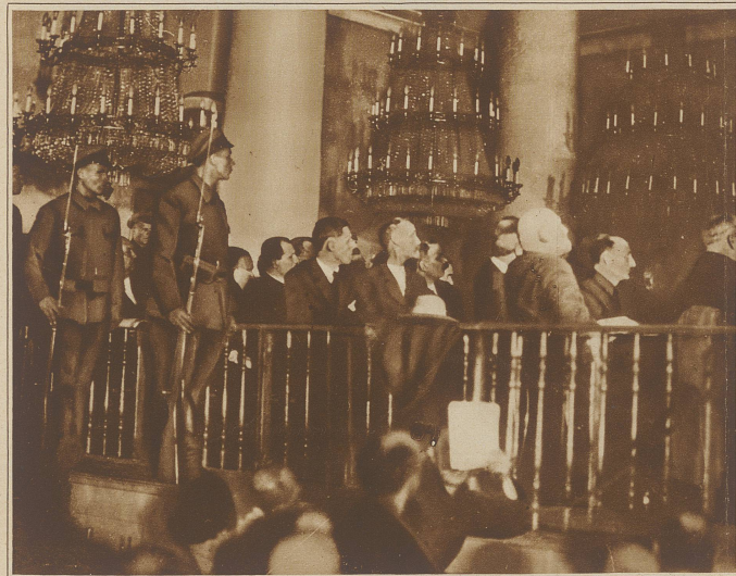
Der Prozeß gegen die Verschwörer des Dones-Beckens. So Russen und drei deutsche Ingenieure sind der «Organisierung und Förderung einer wirtschaftlichen gegenrevolutionären Verschwörung» angeklagt. Es ist damit zu rechnen, daß etwa 50 der angeklagten Russen zum Tode verurteilt werden, während die drei Deutschen aus außenpolitischen Gründen wohl nur mit Freiheitsstrafen davonkommen werden. Das Bild zeigt einen Blick auf die Anklagebank, die von Rotgardisten mit aufgeplatanem Bajonnet bewacht wird