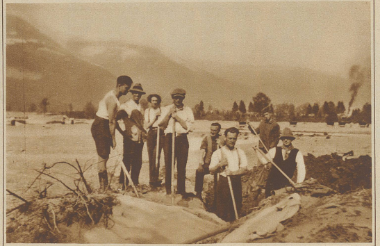
Eine polyglotte Arbeitsgruppe des freiwilligen Hilfsdienstes im liechtensteinischen Dörfchen Schaan: 3 Norweger, 2 Schweizer und je ein Franzose, Engländer und Däne