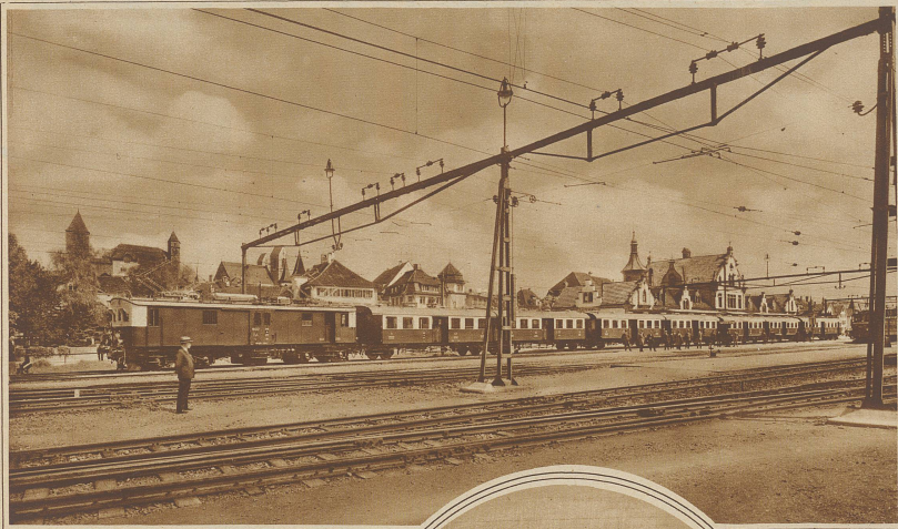
Die neuen Vorentzüge der Schweiz Bundesbahnen, die versuchsweise vorerst auf den Strecken Basel-Olten und Zürich-Rapperswil verkehren werden. Der Zug besteht aus je einem Motorwagen und einem Zugführungswagen, sowie aus drei Doppelwagen, die kurz gekuppelt und durch Faltenbalde und bequemem Übergang verbunden sind. Jedes Rangieren des Motorwagens fällt weg, da der Motorwagen auch von dem an anderen Ende sich befindenden Führerwagen aus gesteuert werden kann, so daß also nur der Führer die Kabine zu wechseln hat. Alle Türen werden vom Führerstand aus automatisch auf einen Schlag geschlossen, sobald sich der Zug in Bewegung gesetzt hat. — Das Rollmaterial des ganzen Zuges wurde von der Schweiz Waggonfabrik Schlieren, die elektr. Ausrüstung von Scheren in Gené geliefert.