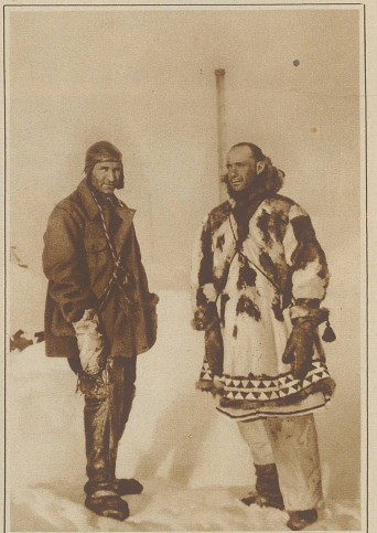
Captain Wilkins und Lt. Eielson bei ihrer Ankunft in Spitzbergen nach der Ueberfliegung des Nordpols