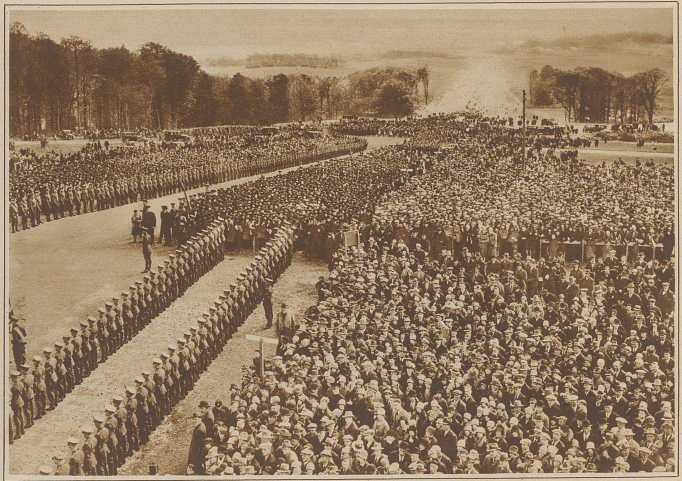
Ein Freudentag in Ulster. Die feierliche Grundsteinlegung für das neue Parlamentsgebäude in Stormont bei Belfast. Damit erstet den Irländern endlich das längst ersehnte äußere Zeichen ihrer Selbstverwaltung