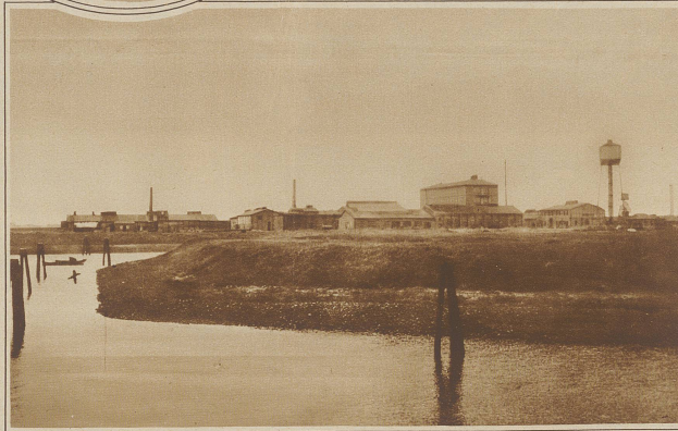
Zur Giftgaskatastrophe in Hamburg. Blick auf das Fabrikgebäude. (X) bezeichnet das Ruderboot, in welchem zwei Angler von den giftigen Gasen überrascht und als erste Opfer getötet wurden