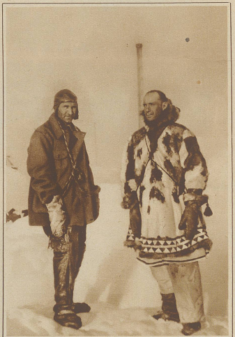
Captain Wilkins und Lt. Eielson bei ihrer Ankunft in Spitzbergen nach der Ueberfliegung des Nordpols