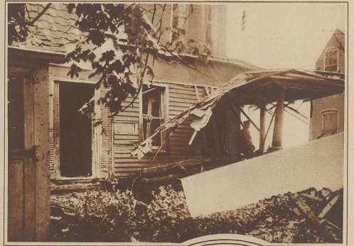
Die Skandalgedichte um die Hinrichtung von Sacco und Vanzetti will nicht zur Ruhe kommen. So wurde vorige Woche gegen das Haus des Henkers Elliott eine Bombe geworfen, die jedoch nur einen Teil der Wohnung zerstörte, während die auf der andern Seite des Hauses schlafenden Bewohner mit dem Schrecken davonkamen