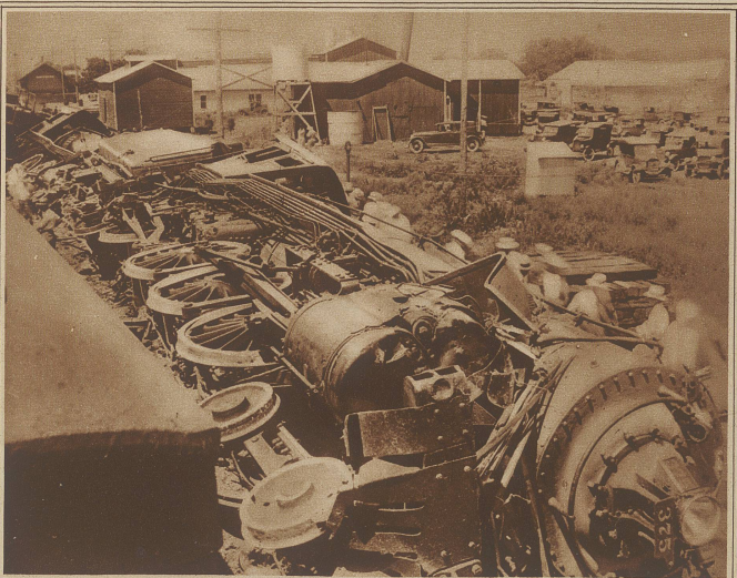
Bei Little River in Texas fuhr ein Eisenbahnzug seitlich in einen andern Zug hinein. Die beiden gewaltigen Lokomotiven des einen Zuges kippten um, während die angefahrenen Personenzüge nur aus dem Geleise gehoben und auf die Seite gestellt wurden. Diesem Umstande ist es zu verdanken, daß nur wenige Passagiere verletzt wurden