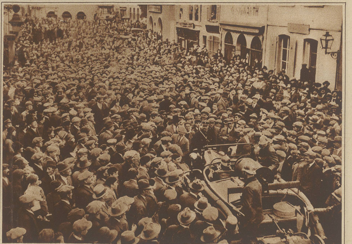
Das Ende des Colmarer Autonomistenprozesses: Feuerwehr rückt aus, um die nach der Urteilsverkündung demonstrierenden Autonomisten zu zerstreuen