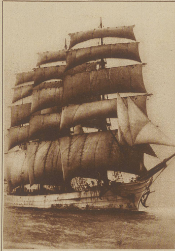
Bild rechts: Verschwindende Romantik Der große schwedische Segler «Beatrice» auf seiner letzten Fahrt