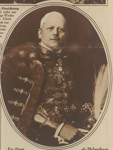
Ein Fürst als Philanthrop Fürst Ladislaus Batthyány-Strattmann, einer der hervorragendsten Magnaten Ungarns, betätigt sich in edler Weise als Augenarzt. Er behandelt, operiert und versorgt alle seine Kranken unentgeltlich auf seine eigenen Kosten. Der Fürst besitzt in seinem Schloß zu Körömend ein Spital für Augenkranken und hält dreimal in der Woche Ordination ab, zu der aus dem ganzen Lande Patienten kommen. Das Spital erhält er aus eigenen Mitteln und er kommt auch für die Heil- und Pflegekosten auf