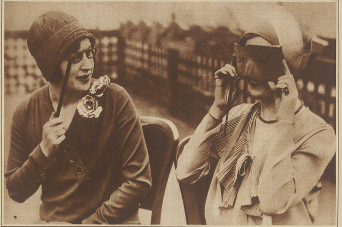
Brillen vergangener Zeiten. Links eine englische Lünette aus der Mitte des vorigen Jahrhunderts, rechts die Brillenmaske, die im Jahre 1280 vom Kaiser von China zur Korrektur seiner Augen getragen wurde