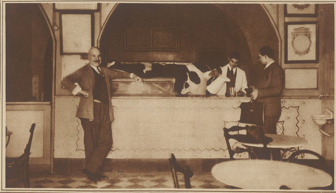
Die Kuh im Milchladen. In Lissabon überbieten sich die Milchhandlungen in der Beteuerung der Unverfälschtheit und Güte ihrer Ware. Ein Händler ist sogar auf die Idee gekommen, die Kuh gleich hinter den Ladentisch zu stellen, damit die Kunden das Frachtexemplar sehen können und so die Milch, die glatte wie ausgeschnitten wird, mit größerem Appetit genießen