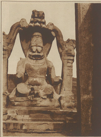
Die aus einem einzigen Granitblock gehauene, 11 m hohe Narasimha-Statue

ca. 700 Elefanten zählende Heer in die Flucht schlugen. Der greise Vijayanagar-König, Rama Raja, fiel dabei in die Hände der Mohammedaner, die ihn töteten und den Kopf, aufgespießt, ihren Scharen vorantrugen und dadurch solches Entsetzen in die Reihen der Hindus brachten, daß diese vor lauter Schrecken keinen Versuch machten, sich zu sammeln und Widerstand zu leisten. / So fiel das stolze und reiche Vijayanagar in die Hände der Mohammedaner, die alles innerhalb der Mauern hinmordeten. Wochenlang dauerte das Hinschlachten der