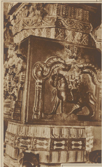
Eine Säule am Vittalswamy-Tempel

Die Ruinen liegen in einer wilden Gegend