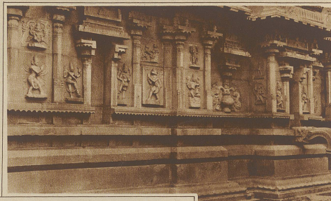
Teilstück der reichverzierten Fassade des Hazara Rama-Tempels

Eine schreckliche Geschichte erzählen uns auch die sog. «Sati»- (Witwenverbrennung) Steine, die da und dort am Wege zu finden sind. Die Witwen-