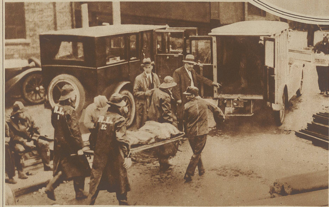
Eine schwere Explosionskatastrophe hat sich in der amerikanischen Kohlengrube Mather, Pa. ereignet, wo durch ein schlagendes Wetter 150 Mann eingeschlossen wurden. Die Rettungsarbeiten gestalteten sich infolge des entstandenen Grubenbrandes äußerst schwierig. Die Zahl der Toten wird auf 64 angegeben.