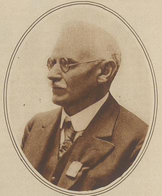
Der berühmte arktische Forschungsreisende, Prof. Otto Nordenskiöld, der eine Reihe wissenschaftlicher Expeditionen in das nördliche Polargebiet führte, ist in Örebro an den Folgen einer Verletzung, die er sich bei einem Autounfall zugezogen hat, gestorben.