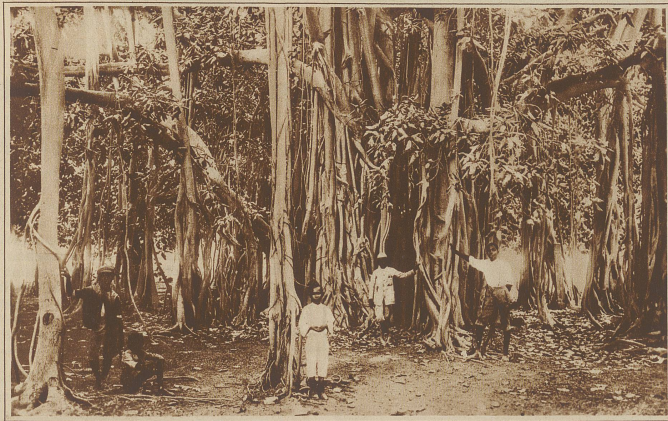
Ein Banjanbaum auf Jamaika, der so weitverzweigt gewachsen ist und aus den Ästen immer neue Wurzeln treibt, daß er einen kleinen Wald für sich bildet.