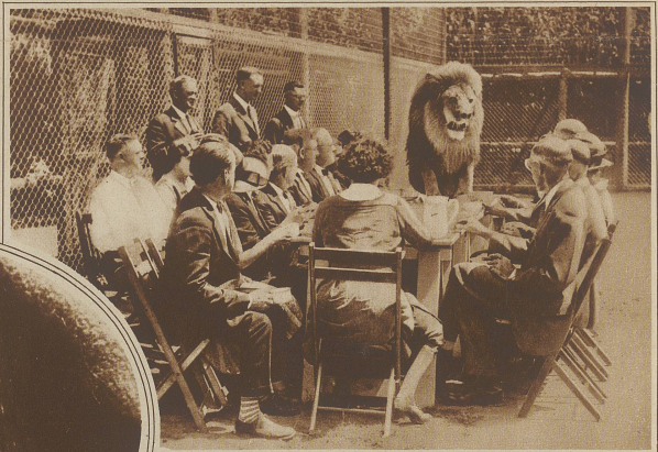
Ein ungebetener Gast. Auf einer kalifornischen Löwenfarm lud der Besitzer eine größere Gesellschaft zu Tische. Das Essen wurde im leeren Löwenkäfig serviert und man saß gemütlich beim Kaffee, als plötzlich ein prächtiger Löwe erschien und sich oben an den Tisch zu der nicht wenig überraschten Gesellschaft setzte.