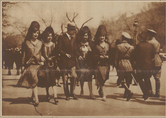
Petasas getragen, während die weiße Mantilla als Schmuck- und Kleidungsstück fürs Theater und für den Besuch der Stierkampfarena verwendet wird. Die Art und Weise, wie die Mantilla über die hohen Zierkämme gelegt wird, ist eine besondere Kunst der Spanierin. — Unsere Bilder zeigen Momentaufnahmen aus der vornehmsten Straße Madrids, der Paseo de Recoletos

Sonntag in Madrid. Nur äußerst selten, meist sogar nur während der Semana Santa, wird von der Spanierin die schwarze Mantilla, dieser kostbare Spitzenschleier im Werte von oft Tausenden von