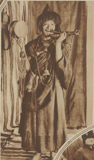
Ein Mediziner im Hochland von Tibet. Er durchzieht die weiten Gebiete zu Fuß und kündigt sein Kommen durch allerlei Musikinstrumente an, die er abwechselungsweise ertönen läßt. Das Instrument, das er gerade bläst, ist aus Menschenknochen verfertigt, die von einem Patienten stammen sollen