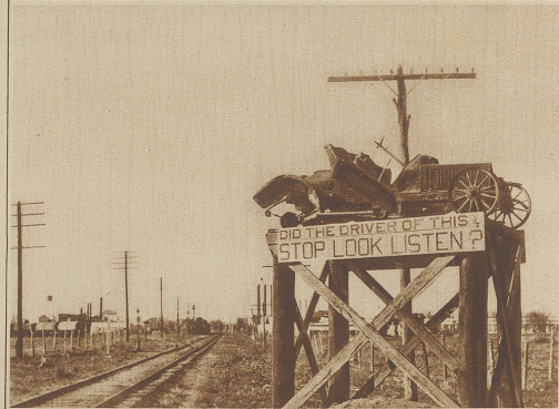
Ein eigenartiges Warnungszeichen für unvorsichtige Automobilisten an einem Bahnübergang bei San Antonio in Texas