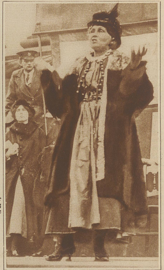
Zur 10jährigen Wiederkehr des Tages der Ermordung der russischen Zarenfamilie in Jekaterinburg Zar Nikolaus und seine Familie

Bild rechts: Emmeline Pankhurst, die streitbare Führerin der englischen Suffragetten, die schon als Schulmädchen in Versammlungen für die Rechte der Frauen kämpfte, ist im Alter von 69 Jahren in London gestorben