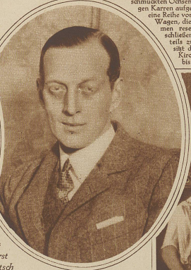
Rechts: Großfürst Pawlowitsch