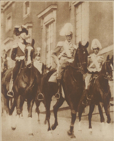
König Gustav von Schweden feierte letzte Woche seinen 70. Geburtstag. Zu seiner Rechten: Kronprinz Karl, links: Prinz Gustav Adolf

Bild rechts: Emmeline Pankhurst, die streitbare Führerin der englischen Suffragetten, die schon als Schulmädchen in Versammlungen für die Rechte der Frauen kämpfte, ist im Alter von 69 Jahren in London gestorben