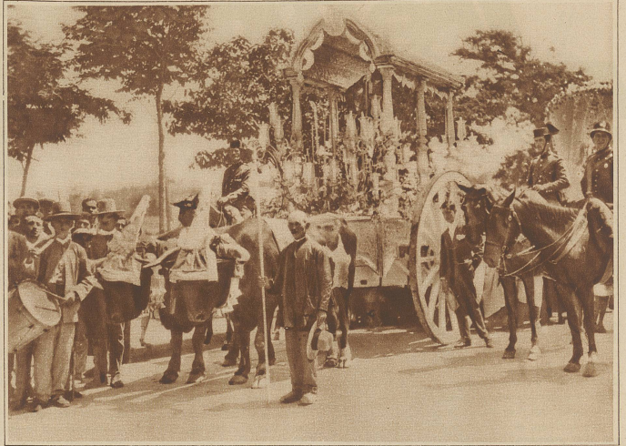
Das Heiligtum der Romeria de la Blanca Paloma

Eine «Romeria» ist in gewissem Sinne als ein Sommerausflug mit einem religiösen Motiv, oder als eine Prozession ohne Götterlichkeit zu bezeichnen. Die Noblesse führt den Zug, dann folgt ein von geschmückten Ochsen gezogenes, auf zweirädrigen Karren aufgebautes Heiligtum, danach eine Reihe von mit Spikes geschmückten Wagen, die ausschließlich für die Damen reserviert sind. Die Männer schließen den Zug, teils zu Fuß, teils zu Pferd, und nicht selten sitzt die Gattin nach andalusischer Art hinten auf dem Pferd. Das Ziel der Prozession ist stets eine berühmte Kirche oder ein Heiligtum, und wenn der Tag zu Ende geht, wird gegessen, getrunken, gesungen und getanzt bis in die schöne andalusische Sommernacht hinein