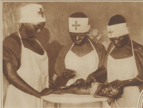
Schwarze Samariterinnen bei der Säuglingsbehandlung in einer Ausbildungsschule für Schwestern im belgischen Kongo