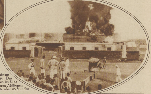
Bild rechts: Feuerausbruch in einem großen Ozeanlager in Bombay. Das Feuer, das auch auf die übrigen im Bilde ersichtlichen Tanks von mehreren Millionen Liter übergriff, brannte über 20 Stunden