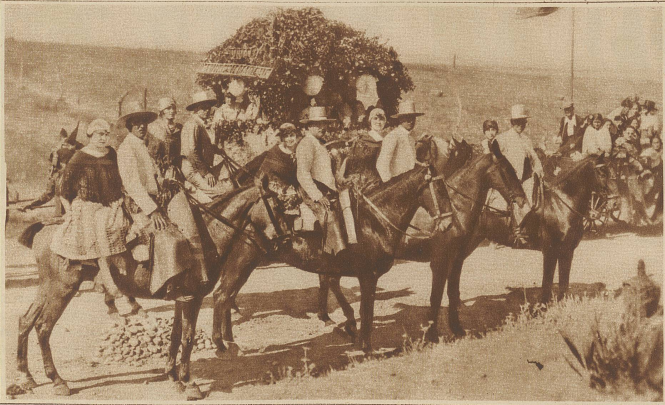
Die typischen andalusischen Paare zu Pferd in der Romeria

Eine «Romeria» ist in gewissem Sinne als ein Sommerausflug mit einem religiösen Motiv, oder als eine Prozession ohne Götterlichkeit zu bezeichnen. Die Noblesse führt den Zug, dann folgt ein von geschmückten Ochsen gezogenes, auf zweirädrigen Karren aufgebautes Heiligtum, danach eine Reihe von mit Spikes geschmückten Wagen, die ausschließlich für die Damen reserviert sind. Die Männer schließen den Zug, teils zu Fuß, teils zu Pferd, und nicht selten sitzt die Gattin nach andalusischer Art hinten auf dem Pferd. Das Ziel der Prozession ist stets eine berühmte Kirche oder ein Heiligtum, und wenn der Tag zu Ende geht, wird gegessen, getrunken, gesungen und getanzt bis in die schöne andalusische Sommernacht hinein