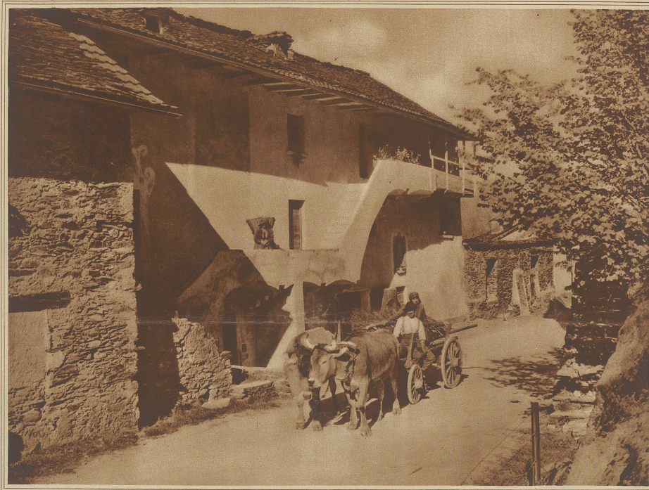
Dorfstraße in Magadino

«Ich weiß nicht, was sie getan hat, aber ich halte die Zeit für gekommen, sie fortzuschicken,» sagte der Oberst, «und so weit ich urteilen kann,