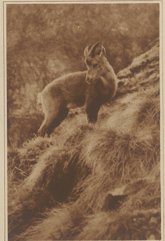
Der zweite der ausgesetzten jungen Steinböcke. Ein letzter Blick noch zur Trägerkolonne und dann geht's hinauf in die Felsen zum schweren Kampf ums Leben

keine Minute,» sagte der Oberst, «nicht einmal, daß Sie es vom Auslande aus täten, denn was ich über Sie weiß, würde genügen, um Sie, wo Sie auch wären, verhaften zu lassen. Jedes Land würde Sie ausliefern müssen.» Er lachte, als Selbys Gesicht immer länger wurde. «Sie sehen also, Selby, daß mein Vorschlag nicht so übel ist. Ich weiß nicht einmal, ob Lollie sich weigern würde, auf gewöhnlichem Wege das Land zu verlassen, aber ich will auf alle Fälle vorbeugen.» «Es ist eigentlich nichts d'bei,» sagte Selby,