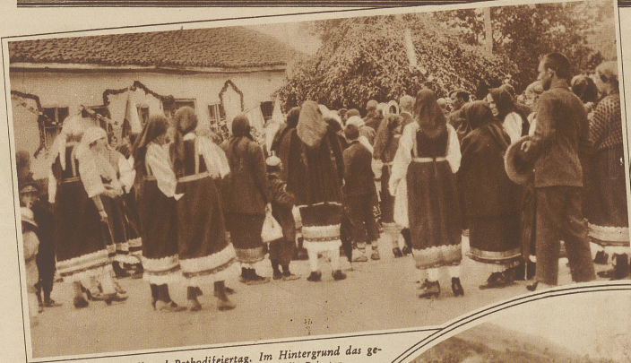
Gottesdienst am Kyrill und Pethodifeiertag. Im Hintergrund das geschmückte Schulhaus, davor die Laubhülle für die Priester