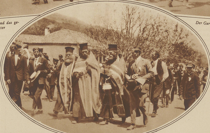
Umzug der Popen