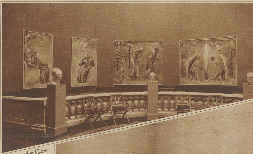
Aus der Cuno Amiet-Ausstellung

Sie durchsuchten sorgfältig die Räume und nahmen sogar jedes Buch einzeln von dem großen Regal herunter, das in einem Erker stand.