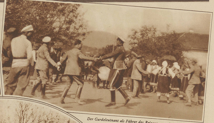
Der Gardeleutnant als Führer des Reigentanzes, bei dem sich hoch und niedrig, reich und arm aneinanderreiht