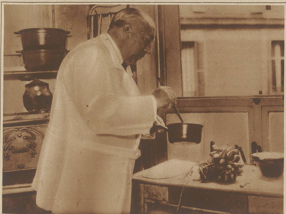
Vom Modedönig zum Kochkünstler. Der Pariser Modeschöpfer Poiret hat neuerdings auch seine Tätigkeit als Schauspieler aufgegeben und sich nun dem kulinarischen Gebiet zugewandt. Seine neueste „Schöpfung“ ist ein Kochbuch, dessen Rezepte er in seiner Küche, wie unser Bild zeigt, selber ausprobirt