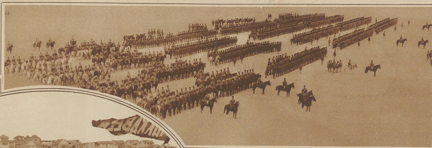
Paradeaufstellung ägyptischer Truppen in der Wüste Heluan BILDER AUS ALLER WELT