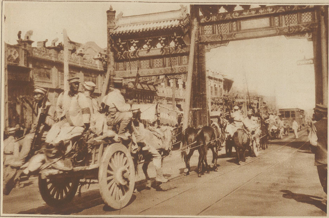
Auf dem chinesischen Kriegsschauplatz. Eine Munitionskolonne auf dem Vormarsch