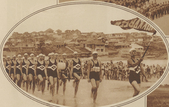
In Australien hat sich ein freiwilliges Lebensrettungskorps gebildet, das längs der Küste in kleine Gruppen aufgeteilt ist. Diese Freiwilligen sind vorzüglich eingetücht und haben schon in vielen Fällen unschätzbare Dienste geleistet. Natürlich wirken auch die Perioden dieser mühselig gebauten Aktiven auf die Badegäste sehr anziehend. Die Aufnahme wurde in Bondi in der Nähe von Sidney gemacht