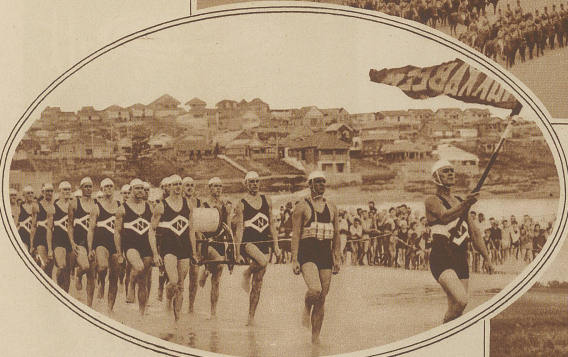
In Australien hat sich ein freiwilliges Lebensrettungskorps gebildet, das längs der Küste in kleine Gruppen aufgeteilt ist. Diese Freiwilligen sind vorzüglich eingetücht und haben schon in vielen Fällen unschätzbare Dienste geleistet. Natürlich wirken auch die Perioden dieser mühselig gebauten Aktiven auf die Badegäste sehr anziehend. Die Aufnahme wurde in Bondi in der Nähe von Sidney gemacht