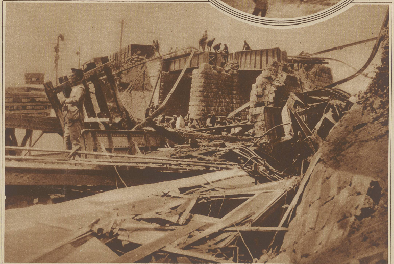
Auf den Sonderzug des Generals Tschang Tso-lin ist zwischen Mukden und Peking ein Bombenattentat verübt worden. Die Explosion riß die Brücke in Trümmer (siehe Bild) und der Salonwagen mit dem chinesischen General stürzte in die Tiefe. Eine große Anzahl Soldaten wurde getötet, während Tschang Tso-lin schwere Verletzungen erlitt, an denen er seither gestorben ist