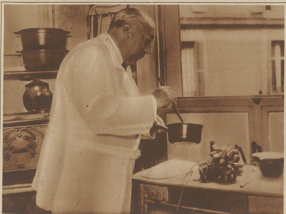
Vom Modekönig zum Kochkünstler. Der Pariser Modeschöpfer Poiret hat neuerdings auch seine Tätigkeit als Schauspieler aufgegeben und sich nun dem kulinarischen Gebiet zugewandt. Seine neueste „Schöpfung“ ist ein Kochbuch, dessen Rezepte er in seiner Küche, wie unser Bild zeigt, selber ausprobirt