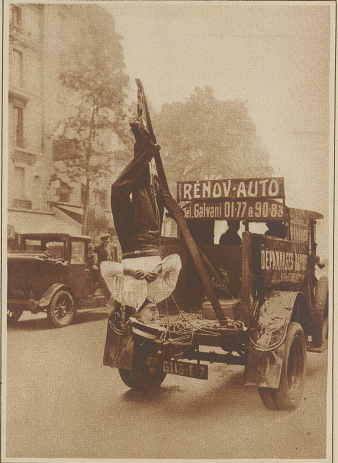
Was man um der lieben Sensation willen nicht alles tut! Der Akrobat Murtyl ließ sich, an den Füßen aufgehängt, durch ein Automobil quer durch die Stadt Paris führen