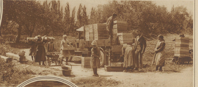
Verladen der Transportkisten

Das gehört zu dem Unheimlichen bei allen furchtbaren Ereignissen: bei Kriegen, Revolutionen, Epidemien, Elementarkatastrophen, dieses Aufblättern von Gerichten, ihr ständiges Sich-