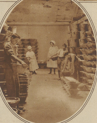
Im Lager der Konservfabrik. Die Erdbeeren bleiben 14 Tage im Fruchtsaft stehen.

verwandeln und ihr phantastisches Anwachsen zu Riesendimensionen. Nirgends bleiben sie ein Spiegel der Wirklichkeit. Sie sind die großen Karikaturisten, die alles ins Groteske und Unwahrscheinliche überreiben. Die Zahlen der Toten, der Verwundeten bekommen schwellende Nullen angehängt und jedes unscheinbare Geschehen kann der Keim zu einem üppig wuchernden Lügengebilde werden. Auch im nüchternsten Menschen sind in aufgeregten Zeiten alle Voraussetzungen gegeben, daß er an diesem verwirrenden Wandel der umherschwirrenden Nachrichten mitschuldig wird. Malt doch die Einbildungskraft jedes einzelnen jedes aufgefangene Gerücht eigenwillig für sich aus und auch nur geringfügige Umformungen der Wahrheit können auf dem Wege von Mensch zu Mensch zu ungeheuerlichen Lügen werden. Man braucht nur bei sich selbst eine Probe zu machen: Unlängst las ich zum Beispiel in einer Zeitung, daß während Streikunruhen in einer Industriestadt ein fünfzehnjähriger Knabe durch einen Schutzmann von einem Baugerüst heruntergeschossen wurde.