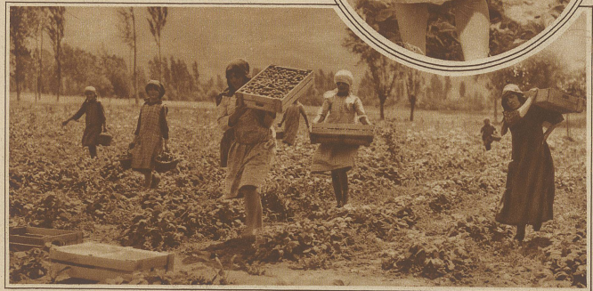
Blick auf ein großes Erdbeersfeld. Die Sammlerinnen tragen die Früchte zweimal im Tag zur Ablieferungsstelle

Sie wandte sich um und flog wieder der Bühne zu, um mit ihren zierlichen Füßchen über Schmerz und Wut hinwegzutanzten. Einen Augenblick lang stand Paul regungslos, erstarrt. Dann tastete er seine Taschen ab, suchte und fand die Waffe. Noch schien er zu überlegen: sie oder ich. Da tanzten die geliebten Beinchen an ihm vorbei, als spotteten sie seiner. Jetzt brach er aus den Kulissen hervor; Schüsse krachten den fliehenden Beinen nach.