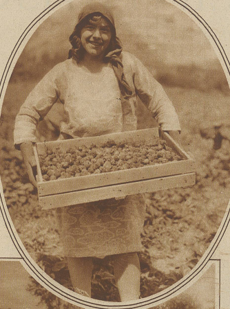
Eine Sammlerin mit ihrer süßen Last