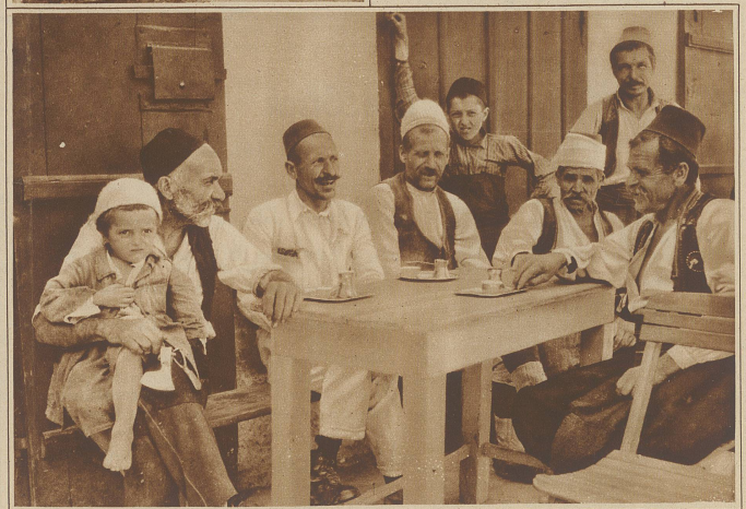
Beim ewigen Kaffee. Eine Szene, wie man sie an jeder Straßenecke beobachten kann