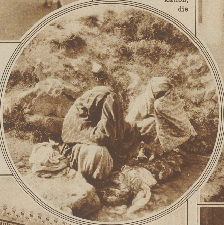
Rechts (im Kreis):

und mit dem alten Uhrturn, der ein Zifferblatt für 24 Stunden als besonderem Schmuck trägt. Die ganze Stadt liegt äußerst malerisch in einer Mulde zwischen zerklüfteten Bergen. In der Tiefe ist die christliche Stadt, die sich nur sehr wenig von irgendeiner andern abendländischen Stadt unterscheidet, in der sich die dichten Häuser-