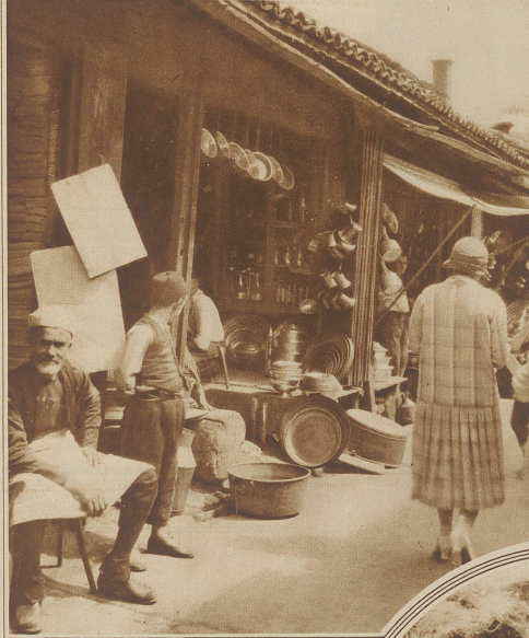
In der Gasse der Kupferschmiede

gruppen um gerade Straßen gruppieren und in der es einige christliche Kirchen gibt, die erst im letzten Viertel des vergangenen Jahrhunderts gebaut wurden. Der mohammedanische Teil der Stadt breitet sich an der Berglehne aus, besitzt steile, winklige Straßen, kleine Häuser, die ganz in orientalischem Stil gebaut sind und eine sehr große Anzahl von Moscheen, von denen die Kaisermoschee (mit dem schon erwähnten Minarett) die größte ist. Die Juden besitzen einige Synagogen. / Das Leben in der Stadt ist sehr rege durch den lebhaften Handel. Besonders beliebt sind die in Serajewo angefertigten bunten Tücher und Teppichwebereien, dann aber auch die schönen Lederarbeiten, die formschönen Kupfer- und Eisengeräte und die mit raffiniertem Geschick angefertigten Messerschmiedearbeiten. Bedeutend ist die Tuchfabrikation, die