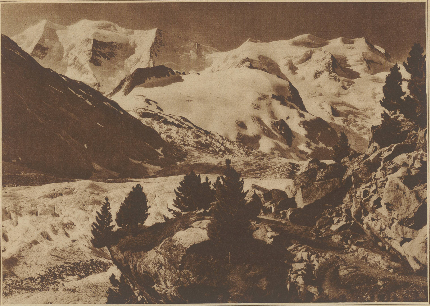
Morterschylsletscher mit Piz Palù und Bellavista