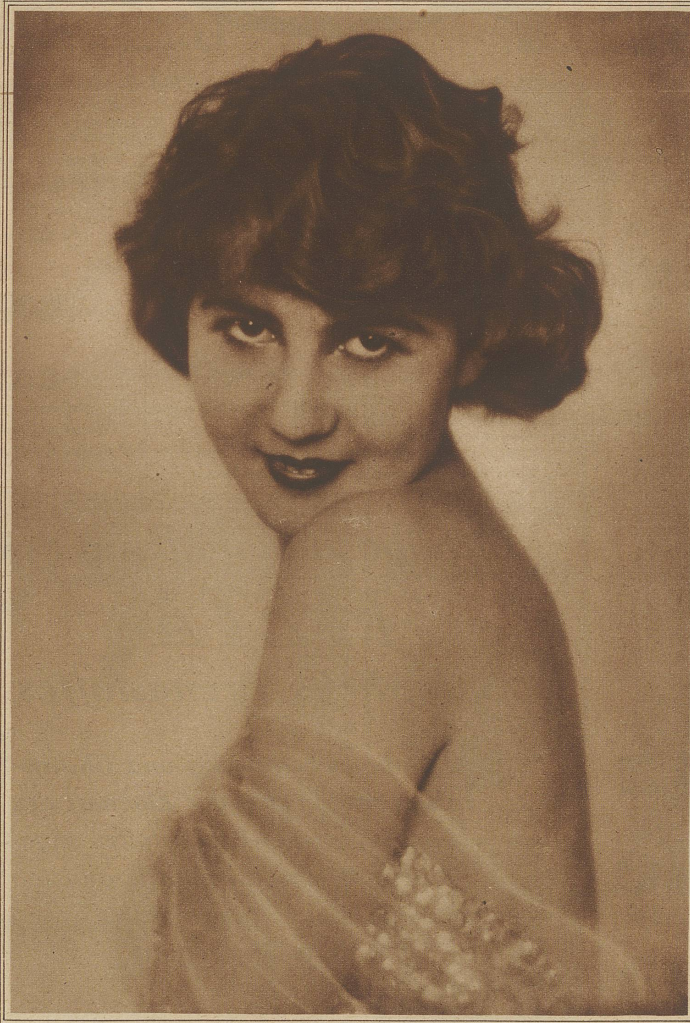
Haben Sie auch so heiß?