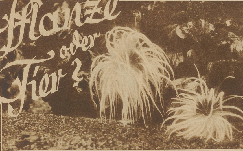
Die Seerosen sind Bewohner des felsigen Ufergebietes, siedeln sich aber auch an Austern- und Miesmuschelschalen fest. Ihre nicht zurückziehbaren Fangarme zeigen oft verschiedenartige Färbung und besitzen Nesselzellen, mit denen selbst größere Beutetiere betäubt werden können.

Was immer es auch zwischen Himmel und Erde gibt, es kann uns durch die Kunst der Photographen sichtbar gemacht werden. Im Flugzeug erheben sie sich über die höchsten Berge und halten das selbst Geschaute im Bilde fest, und in der Ausrüstung von Tauchern lassen sie sich auf den Meeresgrund senken und zeigen uns nachher ein Zauberreich, dessen Herrlichkeit sich keine Phantasie ausdenken könnte. Und hier sind es gerade jene Lebewesen, bei denen wir kaum unterscheiden können, ob sie Pflanzen oder Tiere sind, die unser besonderes Interesse auf sich lenken. Da erhebt sich etwa aus dem schlammigen Meeresgrund ein baumartiges, unendlich feines Gebilde, dessen Aeste von fast unwirklicher Zartheit sind. Erst die genaue Beobachtung aller Funktionen verrät eine tierische Existenz. Und wie unendlich vollkommen ist ihre Eignung für das Leben, nicht nur durch die Einrichtung, sich Nahrung zu verschaffen, sondern auch durch die Fähigkeit, sich gegen Feinde zu schützen. Oder wir sehen etwa Gebilde, die uns an Pinguine erinnern und die