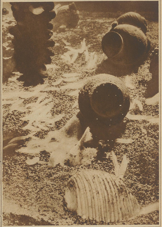
Die Faßschnecke lebt auf sandigem Meeresgrund wühlend. In ihren Speicheldrüsen erzeugt sie Schwefelsäure, mit welcher sie den kohlensauren Kalk der ihr zur Nahrung dienenden Tiere löst.

in Wirklichkeit kleinste Arten von Manteltieren sind, die irgendwo im Meere festsitzen, Nahrung aufnehmen und sich durch Larven fortpflanzen. Auch der Igel hat einen auf dem Meeresgrund lebenden Bruder, nur hat dieser keine eigentlichen Beine, sondern er benützt die Stacheln als Bewegungswerkzeuge. — Nirgends sonst, wie bei den Tieren des Meeres, die in gewisser Beziehung ein Verbindungsstück zwischen Pflanzen- und Tierreich sind, hat die Natur so verschwenderische Formen geschaffen, nirgends sonst gibt es ein so wundersames Märchenreich, dessen namenlose Schönheit uns immer wieder anmutet wie die Schöpfung einer unergründlichen Phantasie.