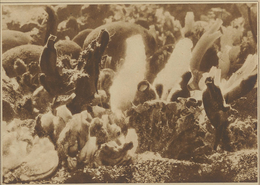
Seescheiden und festsitzende Manteltiere, ihre Larven aber schwimmen frei im Wasser. Der schlauchförmige Körper besitzt zwei Oeffnungen. Durch die eine strömt das Atemwasser und mit ihm die Nahrungsteilchen ein, durch die andere fließt das Wasser wieder ab.

in Wirklichkeit kleinste Arten von Manteltieren sind, die irgendwo im Meere festsitzen, Nahrung aufnehmen und sich durch Larven fortpflanzen. Auch der Igel hat einen auf dem Meeresgrund lebenden Bruder, nur hat dieser keine eigentlichen Beine, sondern er benützt die Stacheln als Bewegungswerkzeuge. — Nirgends sonst, wie bei den Tieren des Meeres, die in gewisser Beziehung ein Verbindungsstück zwischen Pflanzen- und Tierreich sind, hat die Natur so verschwenderische Formen geschaffen, nirgends sonst gibt es ein so wundersames Märchenreich, dessen namenlose Schönheit uns immer wieder anmutet wie die Schöpfung einer unergründlichen Phantasie.