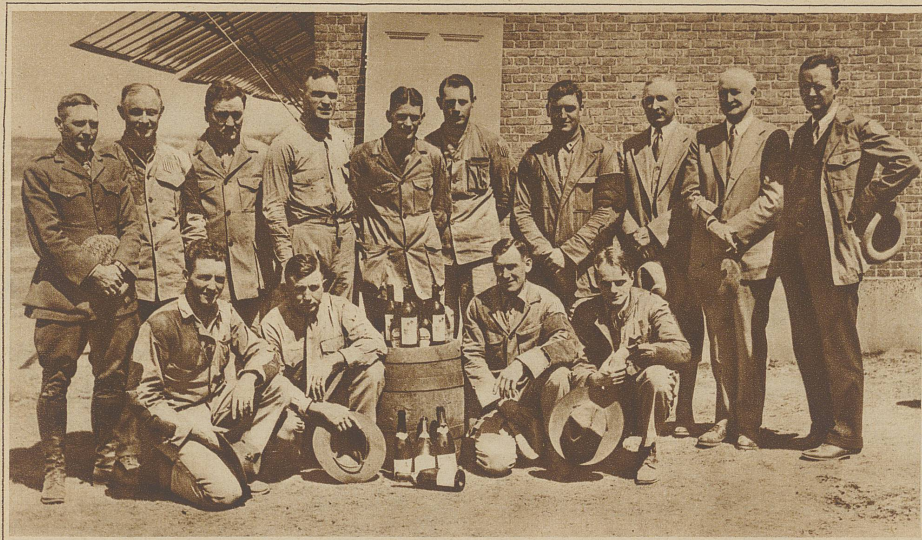
Die amerikanischen Schützen vor dem Stand in Loosduinen. Wie man sieht, benötigten sie nach getaner Arbeit die Anwesenheit in Europa, um dem Prohibitions-gesetz ein kleines Schnippchen zu schlagen