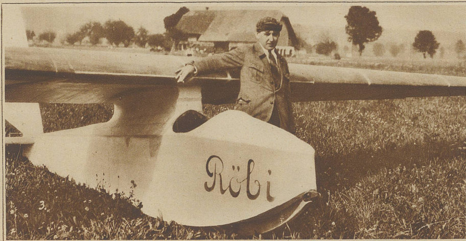
Nach dem Start auf dem Niesen-kulm Phot. Stauffiger