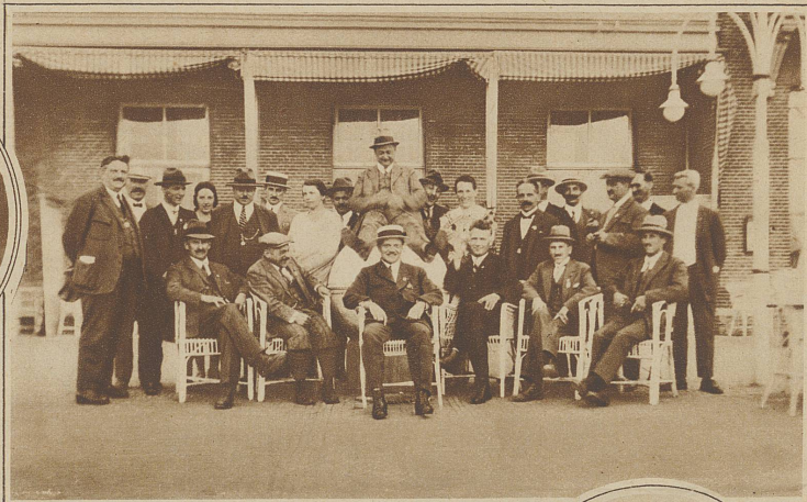
Unsere Schützen vor dem Hotel in Kijkduin