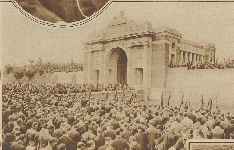
Links: Die religiöse Feier vor dem Denkmal Menin Gate in Ypern Gedächtnisfeier für die Gefallenen von Ypern. Unter Führung des Prinzen von Wales pilgerten letzte Woche 11000 englische Kriegsteilnehmer, begleitet von Witwen und Kindern gefallener Soldaten, zur Erinnerungsfeier beim Soldatendenkmal in Ypern