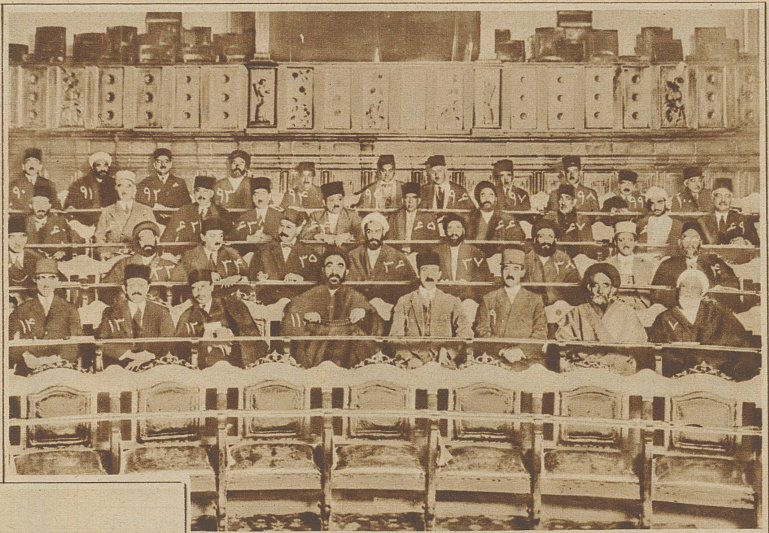
Eine interessante Aufnahme aus dem persischen Parlament während einer Sitzung