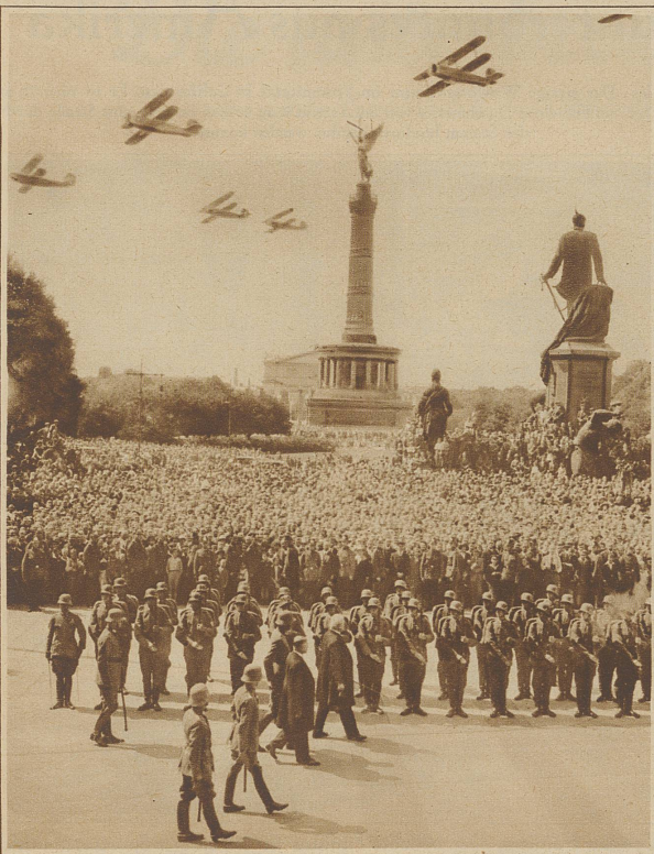
Deutsche Verfassungsfeier am 11. August in Berlin. Reichspräsident Hindenburg schreitet die Front ab