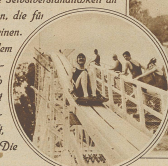
Rechts: Auf der „Wasserpflanzeln“ in Bainsaux-Ouchy

Vor einigen Jahren noch der vielbestaunte Luxus einiger fashionabler Meer- und Seekurorte, sind heute die Strandbäder beinahe eine Selbstverständlichkeit an allen jenen Plätzen geworden, die für die Anlage geeignet erscheinen. Sie sind heute ein Ort, an dem sich eine gemüthliche Geselligkeit entwickelt, wo man sich an gemeinsamem Spiel ergötzt und seinen Körper der wohlthunenden Wirkung von Luft, Sonne und Wasser aussetzt. Die