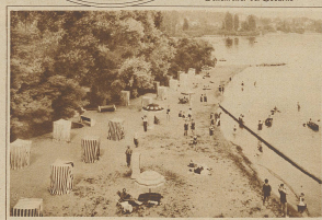
Blick auf die Plage von Bainsaux-Ouchy

Vor einigen Jahren noch der vielbestaunte Luxus einiger fashionabler Meer- und Seekurorte, sind heute die Strandbäder beinahe eine Selbstverständlichkeit an allen jenen Plätzen geworden, die für die Anlage geeignet erscheinen. Sie sind heute ein Ort, an dem sich eine gemüthliche Geselligkeit entwickelt, wo man sich an gemeinsamem Spiel ergötzt und seinen Körper der wohlthunenden Wirkung von Luft, Sonne und Wasser aussetzt. Die