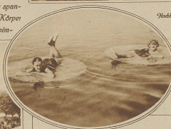
Wild links: Wasser-„Pflanzeln“ im Strandbad Stansstad

Aber auch an den Kurorten erheben sie nicht nur den Reiz der Ferien, sondern spenden dem Körper und Geist erquicklichste Abwechslung.