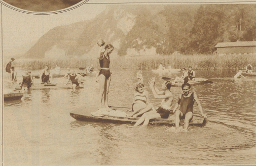
Strandbad Stansstad. Wasser und Sonne, Lust und Wärme

man ein lockendes Ziel zu erreichen. Und wie ergötzt vorerst man sich bei dem reizenden Sand- und Wasser spielen. Harmlos neckisch kommt man sich nahe und sieht in allen Menschen mitfreundliche Brüder und Schwestern, lacht und scherzt mit ihnen und freut sich seiner Unschuldheit, seines Lebens und seiner Kraft. Wannigste Stunden der Erholung und