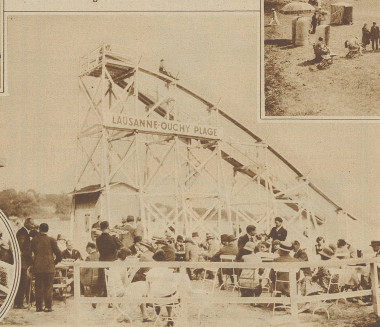
Der Yegarten von Bainsaux-Ouchy-Plage