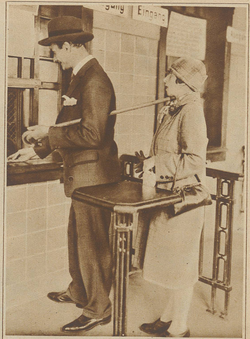
Was hinter seinem Rücken vorgeht, ist ohne jedes Interesse für manchen «Herrn der Schöpfung»