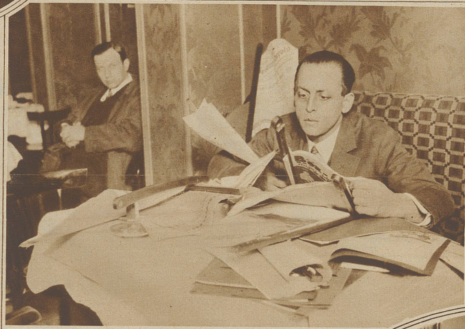
«Wer hat, hat!»

Vergnüglich setzt sich dieser an einen Fensterplatz und bald sieht er zu seiner Rechten eine schöne junge Dame. Soll er ihr den Fenster-