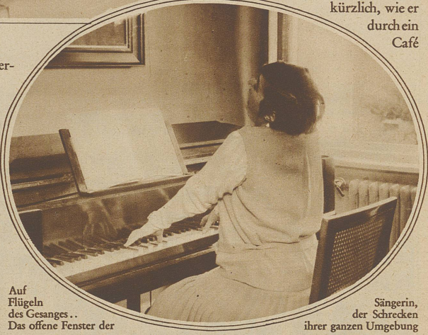
Auf Flügeln des Gesanges... Das offene Fenster der

Vetter von mir hörte kürzlich, wie er durch ein Café