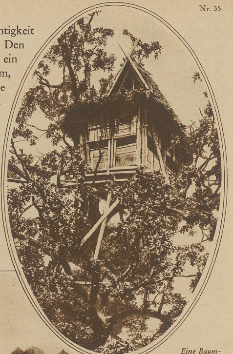
Eine Baumwohnung, wie man sie auf den Philippinen häufig sieht

fahren der Feuchtigkeit geschützt wird. Den Hauptteil bildet ein breitflächiger Turm, an den sich mehrere kleinere anfügen. Die einzige Oeffnung ist der kleine, roh ausgesparte Eingang. Wiederum die Verbindung von Ton und Stroh findet man bei den Bewohnern vom Bismarckarchipel, aber diese