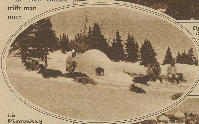
Die Winterwohnung grönländischer Nomaden

An unsere Schuppen erinnern die Bretterhäuser der Eskimos und an die Unterschlupfhütten in den Bergen die Behausungen der Indianer am Paljenan-See oder der Bewohner von Langenstein bei Halberstadt.