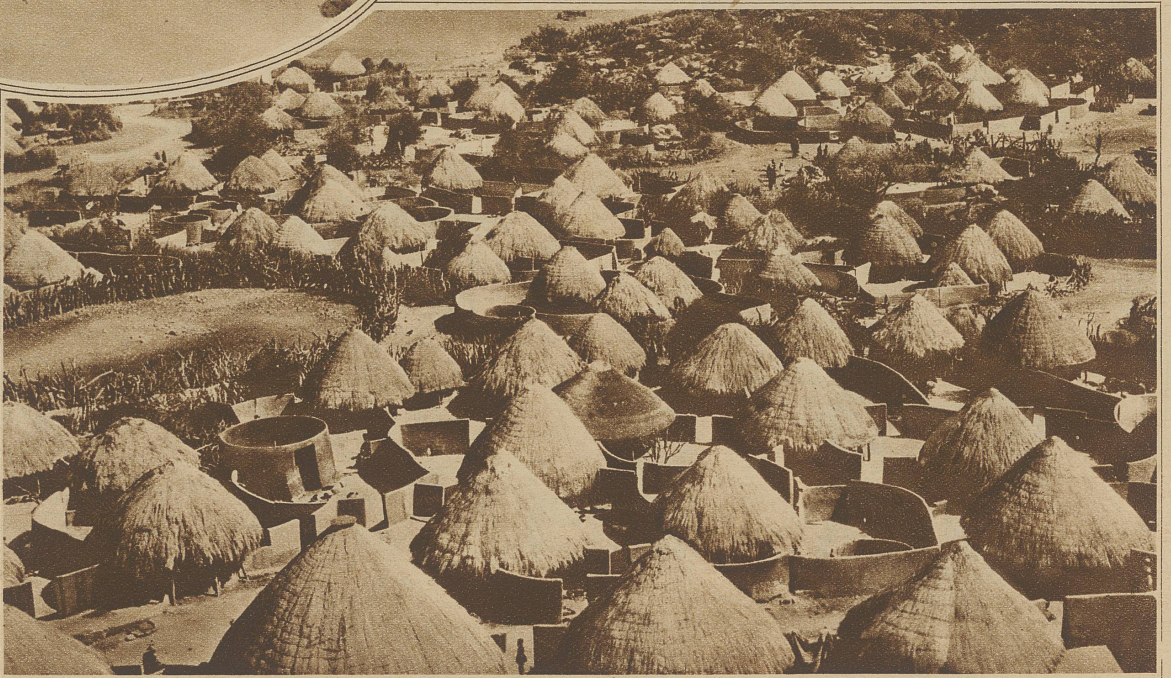
Eine typische Kaffernniederlassung. Jede Hütte ist mit einer Lehm-mauer umgeben, wie die Hütten selber auch aus Lehm gebaut und mit Stroh und Schilf bedeckt sind

Dem Aussehen nach erinnern die Häuser der Eingeborenen Sombas an unsere Festungen. Sie sind ganz aus Ton gebaut, der durch nichts vor den Ge-