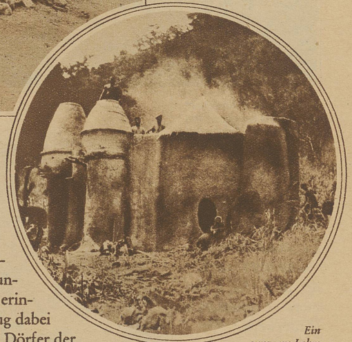
Ein ganz aus Lehm gebautes Wohnhaus der Sombas

eine Tonmauer abgegrenzten Platz, der an unsere Gärten und Höfe erinnert. Es ist seltsam genug dabei zu sehen, wie sich diese Dörfer der Landschaft anpassen und eine malerisch schöne Wirkung erzielen. / Nicht unähnlich sind die Eingeborenenhütten in Südafrika, nur wird hier das Strohdach über ein Gestell aus Holz gespannt. Auch sind diese Hütten mehr nach der Breite als nach der Höhe entwickelt. Die gleiche Form findet man auch bei den Schneehäusern der Grön-