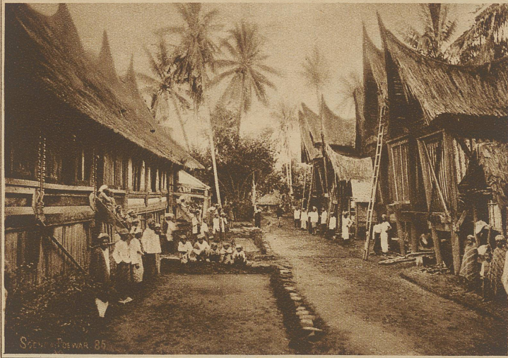
Dorfstraße im Hochlande von Padang an der Westküste Sumatras. Auf der linken Seite stehen die Wohnhäuser, auf der rechten die Reisscheunen

fahren der Feuchtigkeit geschützt wird. Den Hauptteil bildet ein breitflächiger Turm, an den sich mehrere kleinere anfügen. Die einzige Oeffnung ist der kleine, roh ausgesparte Eingang. Wiederum die Verbindung von Ton und Stroh findet man bei den Bewohnern vom Bismarckarchipel, aber diese