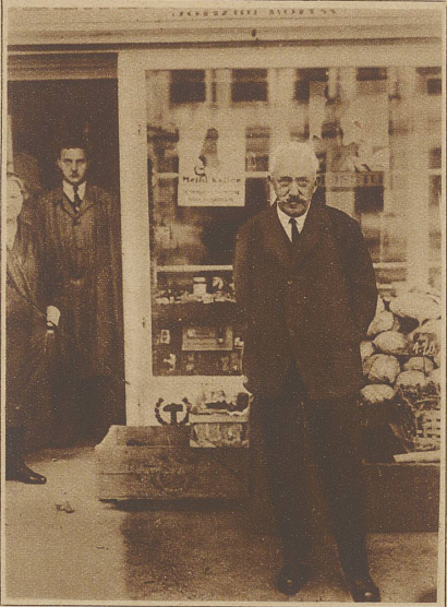
Das Ende des erzhertzoglichen Kolonialwarenladens in Wien. Leopold Wölfling, der frühere Erzherzog Leopold Ferdinand von Oesterreich, der schon öfters von sich reden machte, eröffnete vor einiger Zeit zusammen mit seinem Schwiegersohn in Wien ein Kolonialwarengeschäft. Das Unternehmen glückte aber nicht und der Laden mußte wieder verkauft werden. Das Bild zeigt Leopold Wölfling vor seinem früheren Geschäft.