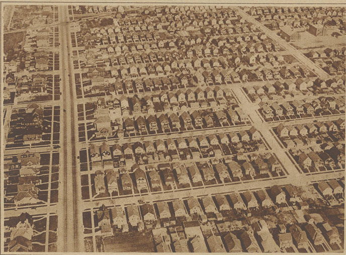
Bild links: Wie das Innere einer Spielzeugschachtel mutet der nordwestliche Teil Milwaukees aus der Vogelschau gesehen an, mit seinen niedlichen in fast völliger Gleichheit ausgeführten Wohnhäusern. Der ganze Stadtteil ist in geradezu vorbildlicher Uebersichtlichkeit angelegt und jedes Haus ist symmetrisch mit Vorgärtchen und geschmackvollem Giebel versehen.