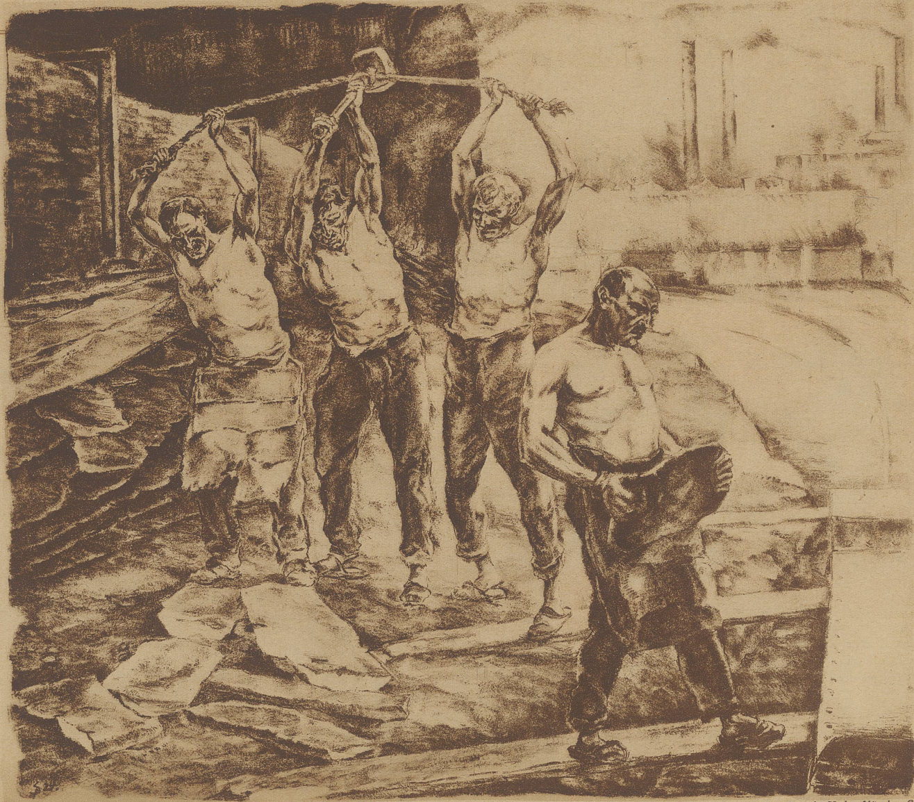
«Troika», Lithographie von Schmidbauer