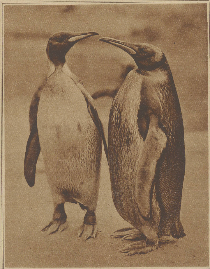
Eine ernste Besprechung politischer Tagesfragen

«Lache und freue dich, roter Bajazzo!» schrie die Frau.