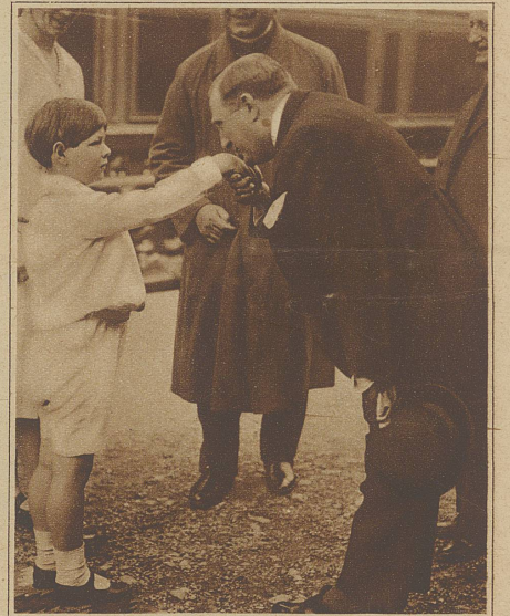
Bild rechts: Der Handkuß. König Michael von Rumänien wird gelegentlich eines Ausfluges von einem Vertreter der Behörde durch Handkuß begrüßt.