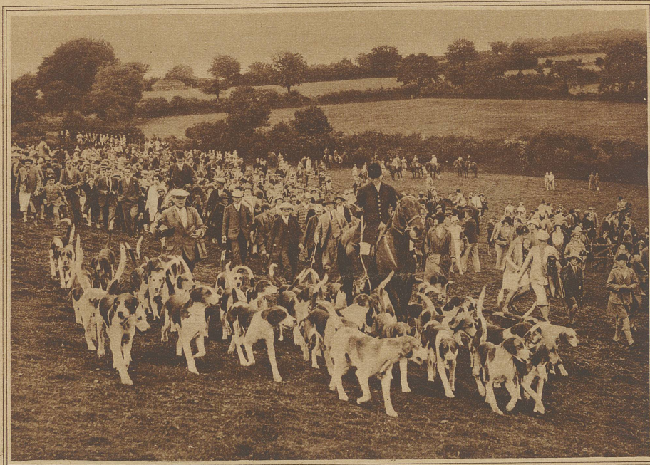
Zum Beginn der englischen Jagdsaison