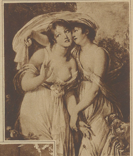
«Zwei Freundinnen» von Greuze

Rubens hat diesen ausgeschaltet. Er malt die Herrin der Sinne. Er wie Rembrandt schreiben im Banne ihrer Frauen, die jene Skala innerer Fülle des Empfindens nicht kennen und diese Ar-