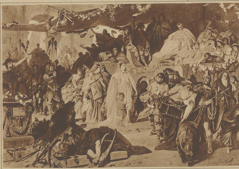
«Thusnelda im Triumphzuge des Germanicus» von C. von Piloty

port in den Werken Tizians an. Feinnervig durchdringt Leonardo da Vinci das rätselhafte Wesen des Weibes. Er bringt zum erstmal das eigene Schönheitsideal in die Kunst aus der eigenen Erkenntnis. Er umspannt alle Grade der Holdseligkeit bis zur Dämonie. Schönheit wird zur Pflicht, zum Strahl des Himmels. So entsteht eine Atmosphäre der Sinnlichkeit, welche die Grenzen zwischen Fürstin und Kurtisane verwischt, in der Tizian Gesetzgeber ist. Er malt das Weib als Königin rauschender Liebesfeste, ihre Schönheit in antiker Ruhe und Geschlossenheit, das Ideal der reifen Frau, die nach dem Kelter der Liebe verlangt. Noch ist Geist in diesen For-