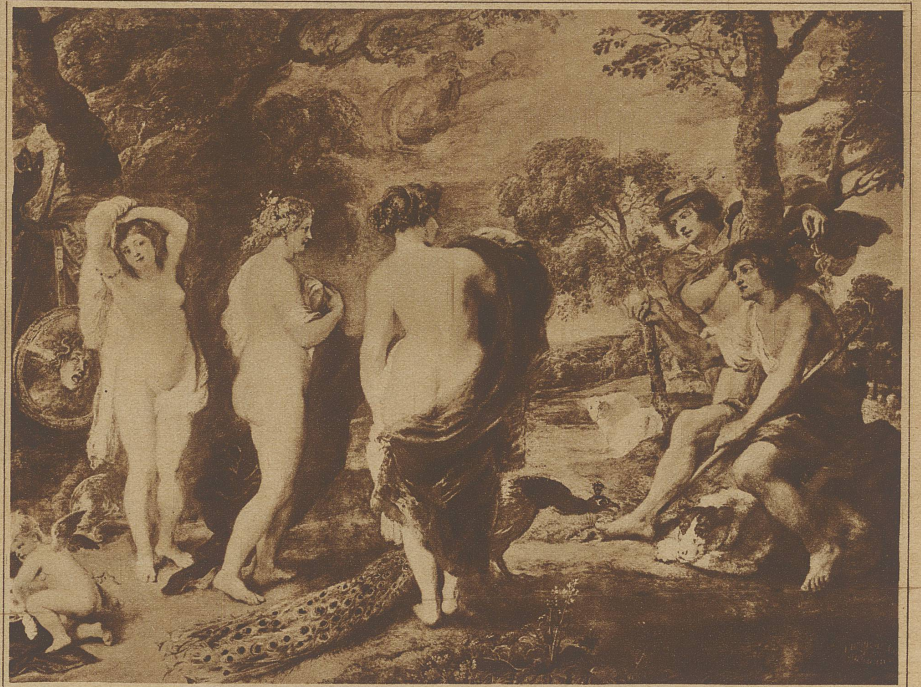
Rubens: Das Urteil des Paris

erweckende Schönheit, ohne jede männliche Tendenz. Die Kunst sich zu kleiden beginnt, deren erotische Wirkung auf der Fülle der Wandelbarkeit und Gestaltungskraft beruht. Jede Bewegung