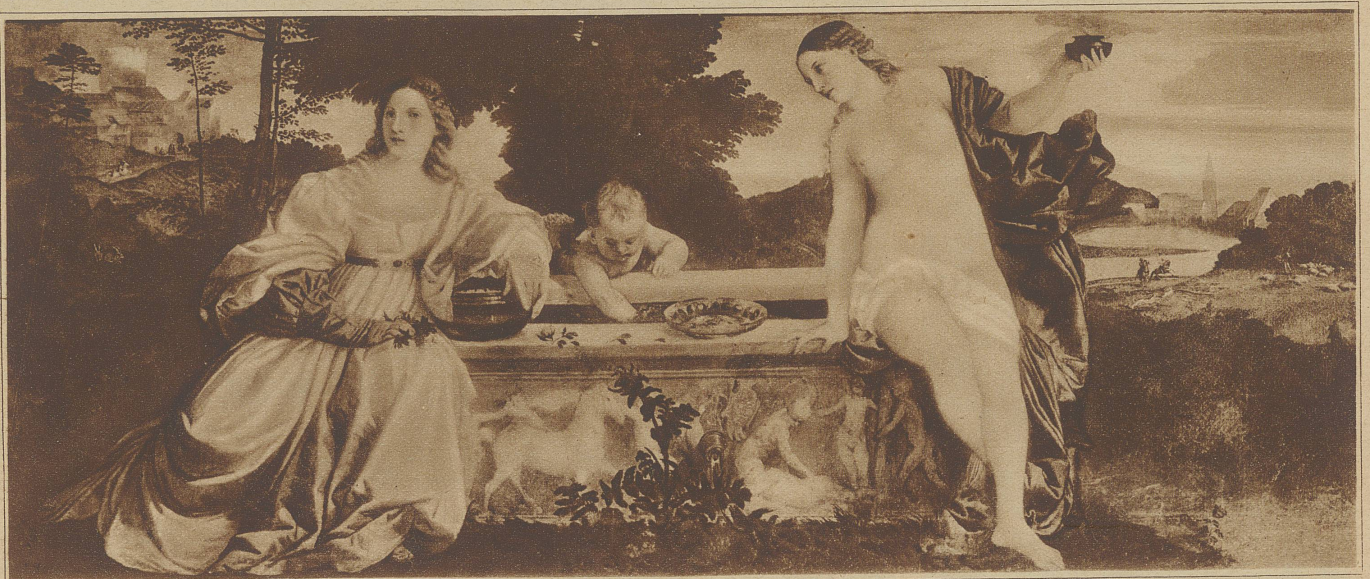
Tizian: Weltliche und geistliche Liebe

port in den Werken Tizians an. Feinnervig durchdringt Leonardo da Vinci das rätselhafte Wesen des Weibes. Er bringt zum erstmal das eigene Schönheitsideal in die Kunst aus der eigenen Erkenntnis. Er umspannt alle Grade der Holdseligkeit bis zur Dämonie. Schönheit wird zur Pflicht, zum Strahl des Himmels. So entsteht eine Atmosphäre der Sinnlichkeit, welche die Grenzen zwischen Fürstin und Kurtisane verwischt, in der Tizian Gesetzgeber ist. Er malt das Weib als Königin rauschender Liebesfeste, ihre Schönheit in antiker Ruhe und Geschlossenheit, das Ideal der reifen Frau, die nach dem Kelter der Liebe verlangt. Noch ist Geist in diesen For-