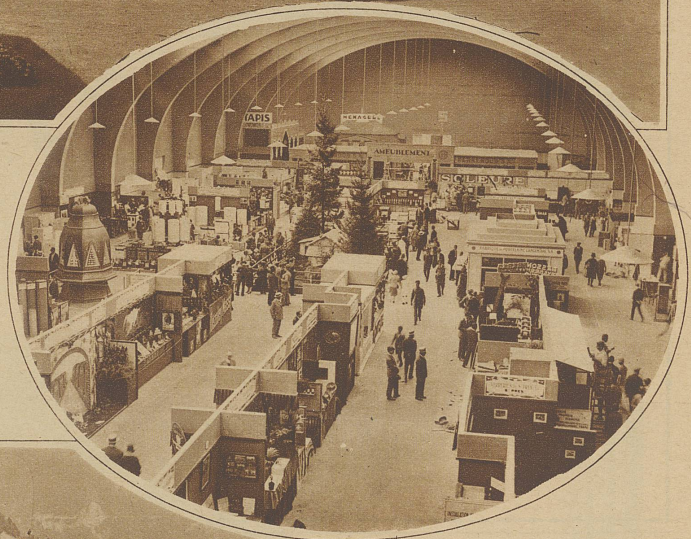
Im Oval: Die große Ausstellungshalle