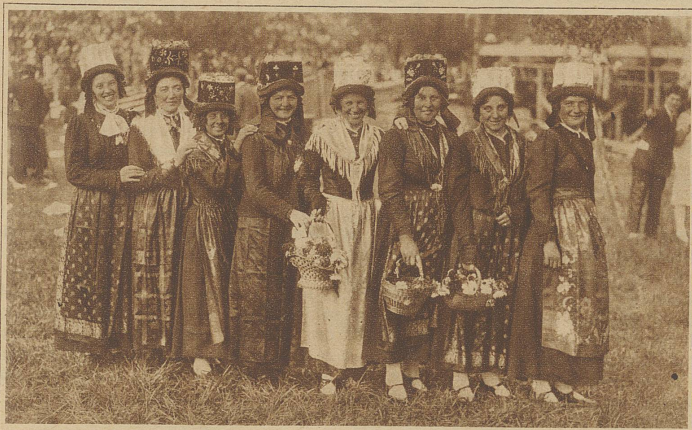
Trachtengruppe aus dem Lötschental