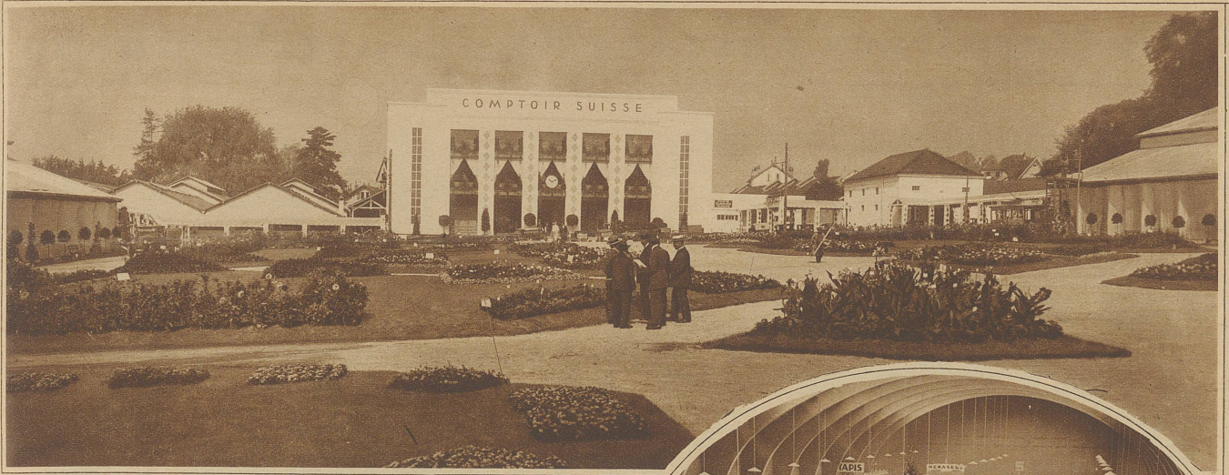
Blick auf die Messegebäude vom Haupteingang aus