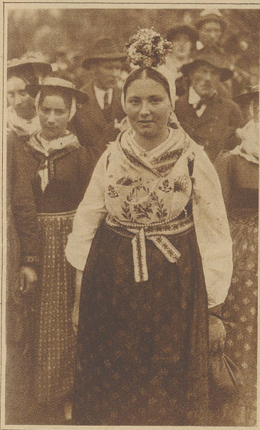
Dorfschöne aus dem Evolène im Brautschmuck