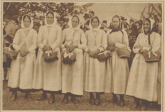
Frauen aus Salvan in ihren einfachen aber deshalb nicht minder schönen Trachten