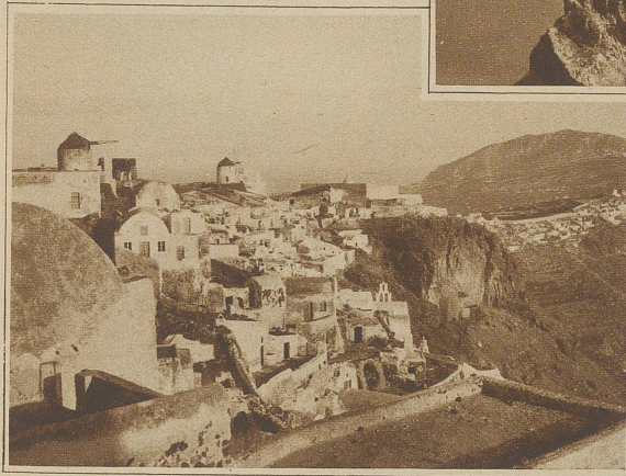
Phira von Osten gesehen

dachung des Kraterandes, die streckenweise nur sanfte Neigung hat, ist fast ganz mit Rebbergen bedeckt, in denen ein prickelnder Malvafier wächst; der ganze Reichtum der Inselbewohner. / Mitten im Innern des Kraters sind in mehreren großen Eruptionen in den Jahren 197 v. Chr. und 19, 46, 726, 1570 und 1707-1711 Lavainseln entstanden, denen ständig Schwefel- und Salzsäuredämpfe entweichen. So ruhig und tiefblau das Meer in diesem Kraterschlund auch daliegt, nie sind die Bewohner dieses eigenartigen Eilandes sicher, wann das schlafende Ungeheuer wieder erwacht und Tod und Verderben ausstößt. E. Rüd