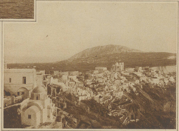
Blick auf das prächtig gelagerte Phira

Weit draußen im östlichen Mittelmeer, wo die Inselwelt der Aegäis den früheren Zusammenhang des Peloponnes mit Kleinasien ahnen läßt, erhebt sich aus der tiefblauen Flut ein ovaler Vulkankrater von etwa 30 Kilometer Umfang. Dieser gewaltige Kraterwall, der 200 bis 300 Meter über den Meeresspiegel ansteigt, bildet aber kein Ganzes mehr; er ist geborsten, zerrissen und durch die großen Lücken im westlichen Teil ist das Meer in den Höllenschlund gedrungen, der da in prähistorischer Zeit der salzigen Flut entstieg. Die größten Schiffe können ungehindert in das Innere des Kraters fahren, der eine Tiefe von 300 bis 400 Meter aufweist. Die Kraterwände fallen gegen das Innere ungemein steil ab und leuchten in allen Farben erstarr-