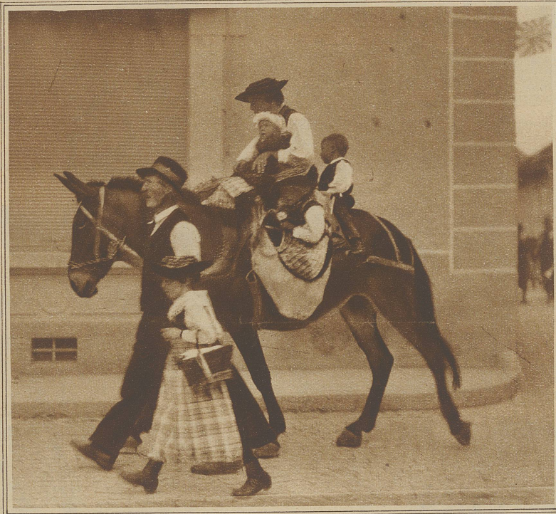
Sonntagsausflug einer Walliser Bergbauernfamilie.