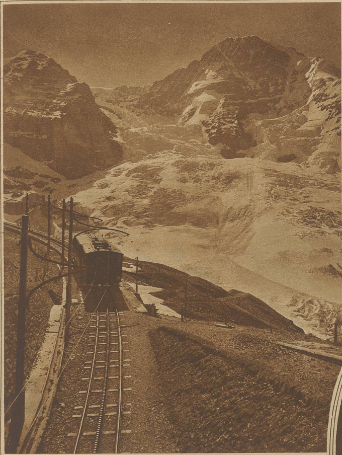
Blick von der Jungfrauabahn auf Mönch und Eigersletscher