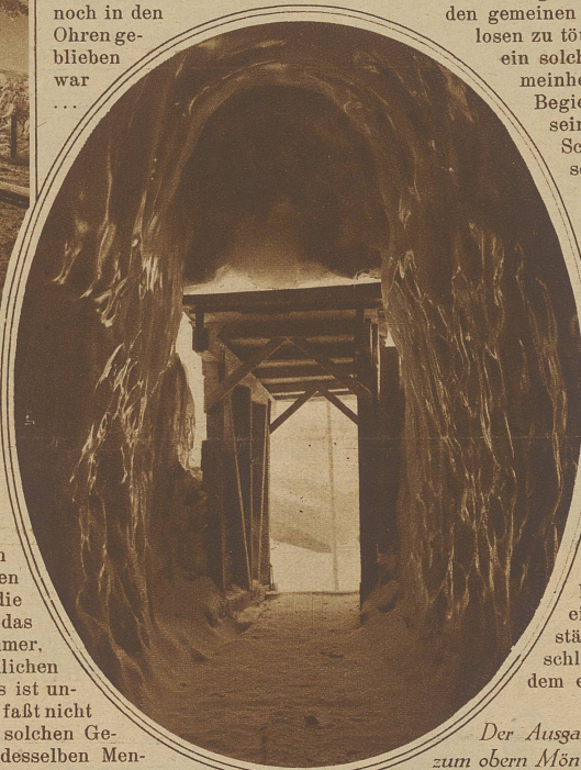
Der Ausgang des Sphinxstollens zum obern Mönchsloch

den gemeinen Verräter und Treulosen zu töten! Aber hier ist ja ein solcher Abgrund der Gemeinheit, eine so teuflische Begierde, die Seele selbst seines Feindes in den Schmutz zu zerren, eine solche Beschimpfung des eigenen Gewissens und der Würde, daß der menschlichen Sprache ein Wort fehlt, mit dem man diese Ausartung eines Kulturmenschen in ein überriechendes Ungeheuer bezeichnen könnte! Er hatten nicht einmal den heimlichsten Winkel seiner und der fremden Seele geschont — ihre Liebe in der fernen Vergangenheit; hatte ihn durch ein neues Liebesgeständnis und den Vorschlag, das Leben mit dem eigenen Fleisch los-