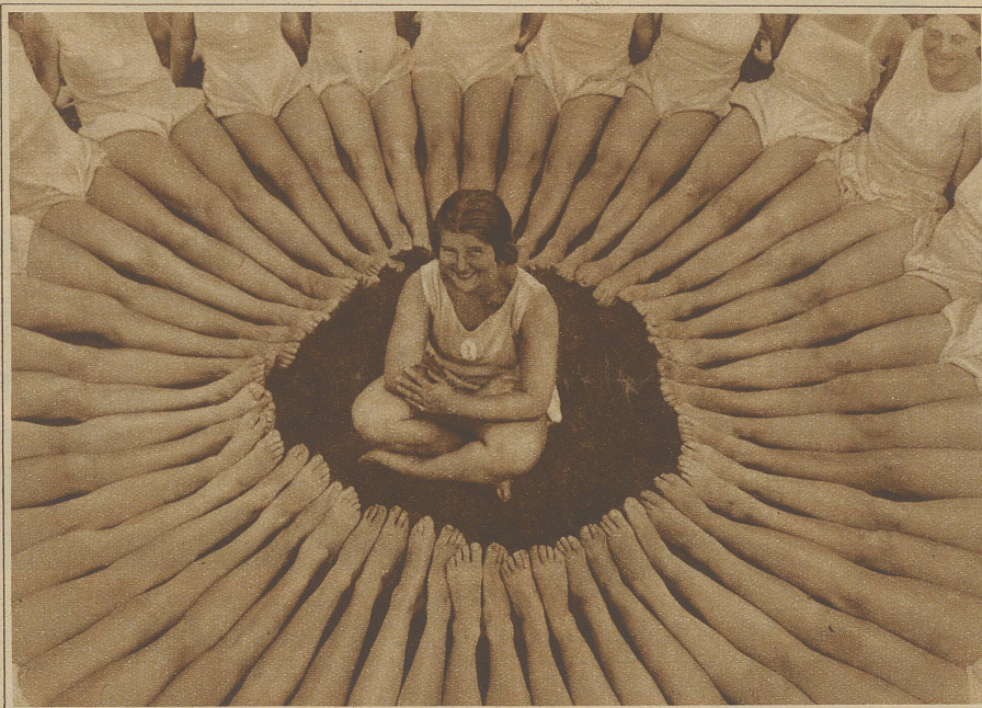
Schülerinnen einer Tanzschule amüsieren sich während einer Erholungspause

rantschuk trocknete sich mit einem Taschentüchlein die Tränen, kicherte aber schon in dünnem Tenor: