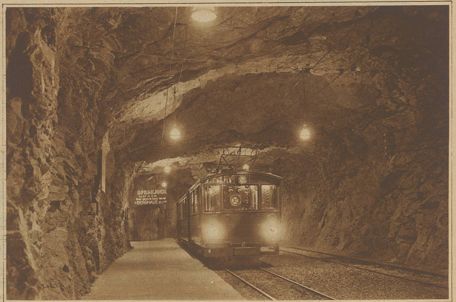
Rechts: Die 3457 m hoch gelegene Station Jungfrauoch