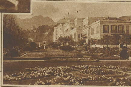
Das Kasino in Menton

dem guten Geschäfte verhelfen. Ihr Gewinn wirkt ermutigend auf die übrigen Spieler und nicht nur das, er spricht sich in der Welt herum und wird zur lockenden Reklame. Ein solcher Glücksspieler tauchte vor dem Krieg plötzlich einmal in Monte Carlo auf. Dieser Spanier brauchte nur zu setzen und der Gewinn war ihm sicher. Millionen flossen ihm zu. Eines Tages verließ ihn das Glück. Er machte noch einige Versuche — — erfolglos. Da