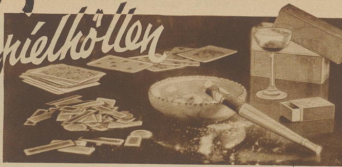
Stilleben auf dem Spieltisch

Man nennt sie Spielhöllen, jene verschwenderisch reichen Säle mit den grünen Tischen, den weichen Polsterstühlen, den bemalten Wänden und Decken, den Marmorsäulen und den prunkvollen Leuchtern. Jene Säle, in denen kein Laut so oft erklingt als die monoton gesprochenen Sätzchen: «Faites vos jeux, Messieurs» — «Rien ne va plus!» Und dazwischen liegt das Glück, liegt der Reichtum, liegt aber auch die Not, der Tod. Doch niemand hat die Psychologie des Spielers geschrieben, wenn auch Bücher von dem Leben der Spieler berichten. Dostojewski, der zu Zeiten selbst