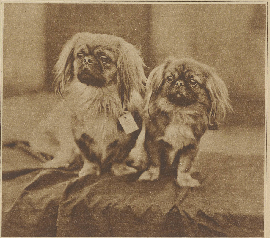
Zwei entzückende Pekinesen