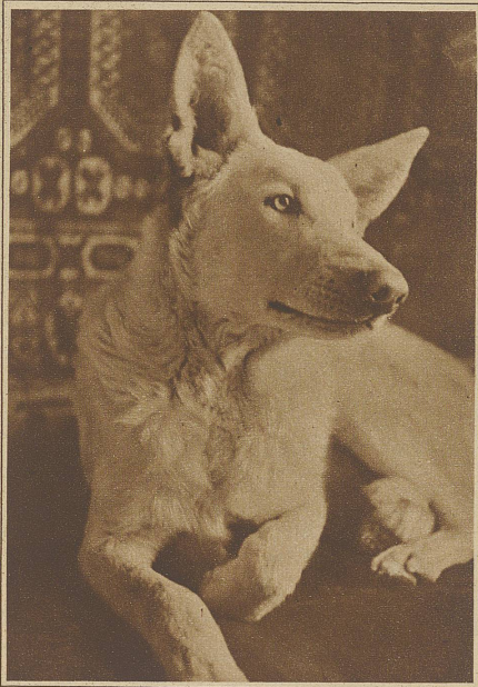
Weißer deutscher Schäferhund, eine seltene Farbe bei den sogenannten Wolfshunden

Bohnen fürs Abendessen fallen lassen! Und wie das alles kam! Der Topf ist ihm nicht einmal ausgerutscht — direkt hingeschmissen hat er ihn.