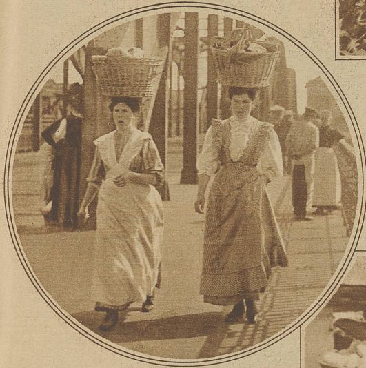
Frauen aus Bingen tragen Waren zum Markt über die Rheinbrücke

Bei uns ist es nur noch wenig gebräuchlich, größere Lasten auf dem Kopfe zu tragen, aber in den Berggegenden sieht man immer noch Frauen, die mit aller Selbstverständlichkeit oft große Körbe, mit den mannigfaltigsten Dingen angefüllt, nach der Art eines Hutes tragen. Auch in Süddeutschland und Belgien gehören solche Frauen, besonders an den Markttagen, unbedingt in das Stadtbild. Und die Hafenstädte von Frankreich und Spanien kann man sich überhaupt nicht vorstellen ohne die Frauen, die auf ihrem Kopfe die schwersten Fischkörbe mit einer erstaunlichen Sicherheit balancieren.