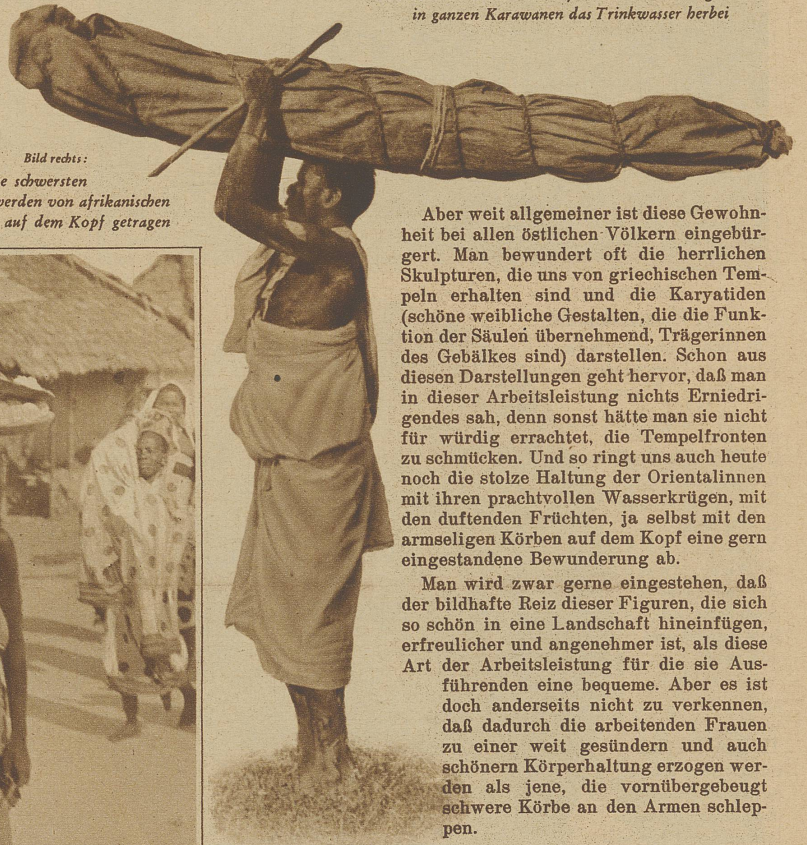
Bild rechts: Selbst die schwersten Lasten werden von afrikanischen Trägern auf dem Kopf getragen

Aber weit allgemeiner ist diese Gewohnheit bei allen östlichen Völkern eingebürgert. Man bewundert oft die herrlichen Skulpturen, die uns von griechischen Tempeln erhalten sind und die Karyatiden (schöne weibliche Gestalten, die die Funktion der Säulen übernehmend, Trägerinnen des Gebälkes sind) darstellen. Schon aus diesen Darstellungen geht hervor, daß man in dieser Arbeitsleistung nichts Erniedrigendes sah, denn sonst hätte man sie nicht für würdig errachtet, die Tempelfronten zu schmücken. Und so ringt uns auch heute noch die stolze Haltung der Orientalinnen mit ihren prachtvollen Wasserkrügen, mit den duftenden Früchten, ja selbst mit den armseligen Körben auf dem Kopf eine gern eingestandene Bewunderung ab.