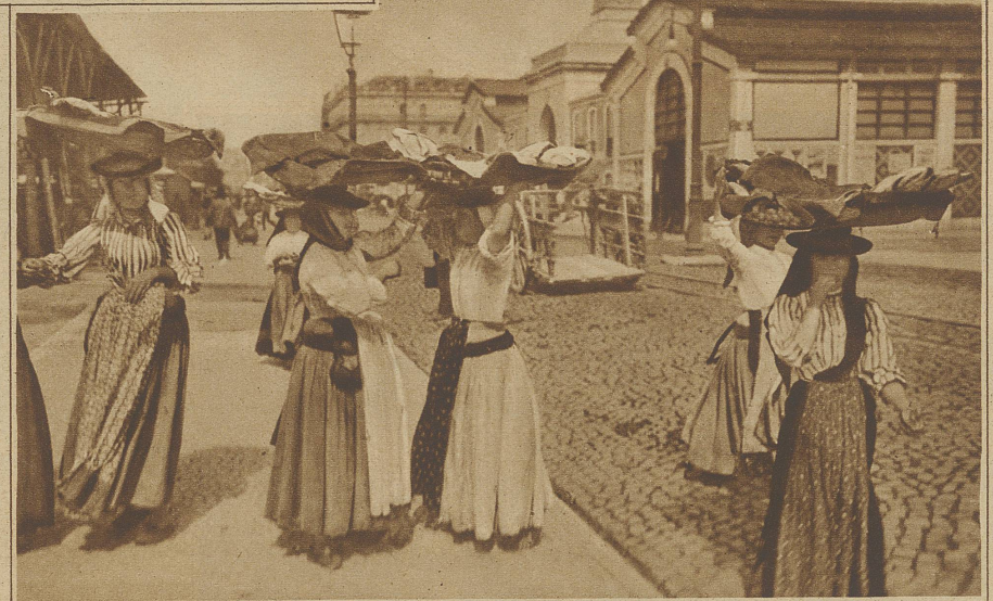
Fischverkäuferinnen aus Lissabon