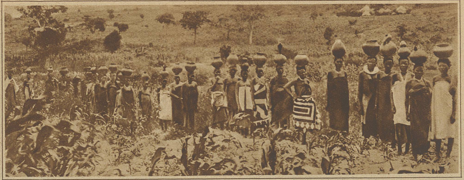
In trockenen Gebieten Ostafrikas holen die Negerinnen in ganzen Karawanen das Trinkwasser herbei