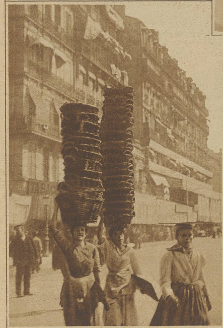
Unteres Bild: Rückkehr vom Wochenmarkt in Marseille

Bei uns ist es nur noch wenig gebräuchlich, größere Lasten auf dem Kopfe zu tragen, aber in den Berggegenden sieht man immer noch Frauen, die mit aller Selbstverständlichkeit oft große Körbe, mit den mannigfaltigsten Dingen angefüllt, nach der Art eines Hutes tragen. Auch in Süddeutschland und Belgien gehören solche Frauen, besonders an den Markttagen, unbedingt in das Stadtbild. Und die Hafenstädte von Frankreich und Spanien kann man sich überhaupt nicht vorstellen ohne die Frauen, die auf ihrem Kopfe die schwersten Fischkörbe mit einer erstaunlichen Sicherheit balancieren.